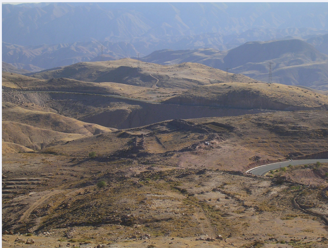
FIGURA 2. Vista panorámica de Catama Tambo.

variabilidad física de los tambos expresa versatilidad de sus funciones, articulación con grupos locales, así como funciones políticas a nivel local y regional.