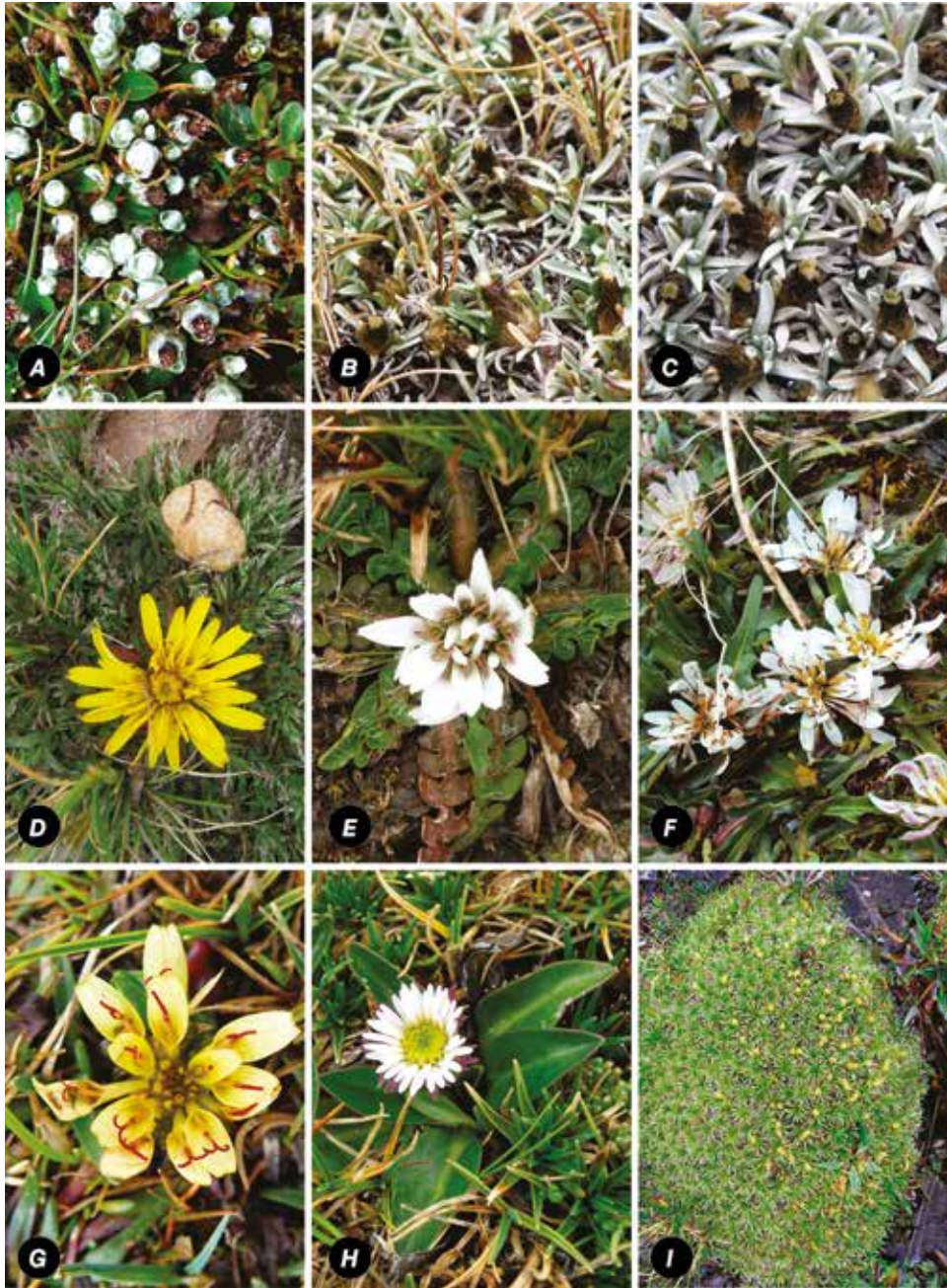
FIGURA 1: A) CUATRECASASIELLA ISERNII ; B) LUCILIA CONOIDEA ; C) LUCILIA KUNTHIANA ; (D, E) HYPOCHAERIS EREMOPHILA ; (F, G) HYPOCHAERIS TARAXACOIDES ; (H) ORITROPHIUM LIMNOPHILUM ; (I) NOVENIA ACAULIS .