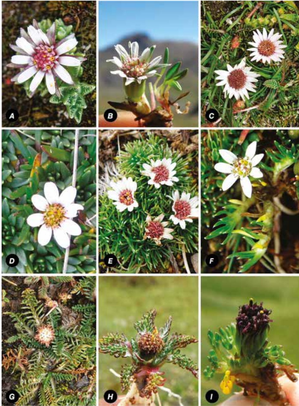
FIGURA 3: A) WERNERIA PECTINATA ; B) WERNERIA SPATHULATA ; (C) WERNERIA APICULATA ; (D) WERNERIA PYGMAEA ; (E) WERNERIA CAESPITOSA ; (F) WERNERIA SP. ; (G) WERNERIA HETEROLOBA ; (H) WERNERIA OBTUSILOBA ; (I) WERNERIA SOLIVIFOLIA .