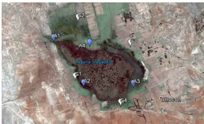
FIGURA 3. PUNTOS DE MUESTREO DE SUELO (S1, S2, S3 Y S4) Y AGUA (A1, A2, A3 Y A4).