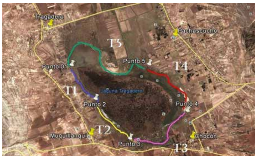
FIGURA 2. TRANSECTOS RECORRIDOS PARA EVALUACIÓN DE AVIFAUNA.

espacios característicos en el humedal (orilla, cuerpo de agua, totorales, praderas y pastizales, campos agrícolas y espacio aéreo). La evaluación se realizó en horarios matinales (7 a. m. - 11 a. m.) y en la tarde (2 p. m. - 4 p.m.) recorriendo transectos distribuidos al borde del cuerpo de agua (figura 2). Adicionalmente, se realizó un censo a la población de parihuanas ( Phoenicopterus chilensis ), evaluando las zonas de preferencia de la especie.