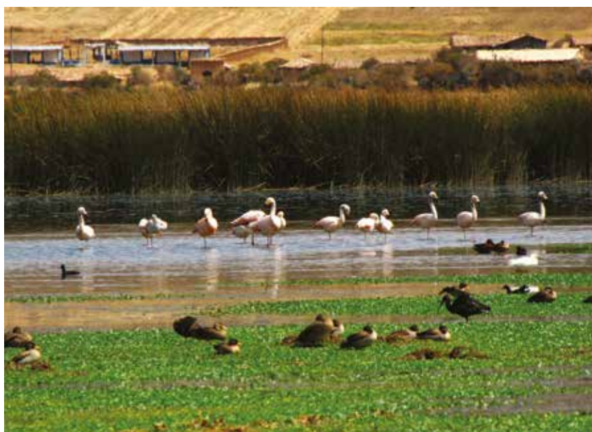
FIGURA 4. INDIVIDUOS DE PARIHUANA EN EL SECTOR NORTE. SE OBSERVA EN SEGUNDO PLANO EL POBLADO DE MUQUILLANQUI.

La población de parihuanas ( Phoenicopus chilensis ) está conformada por 8 juveniles y 52 adultos. Los individuos mostraron preferencia por el sector norte del humedal tanto para descanso como para forrajeo (figura 4).