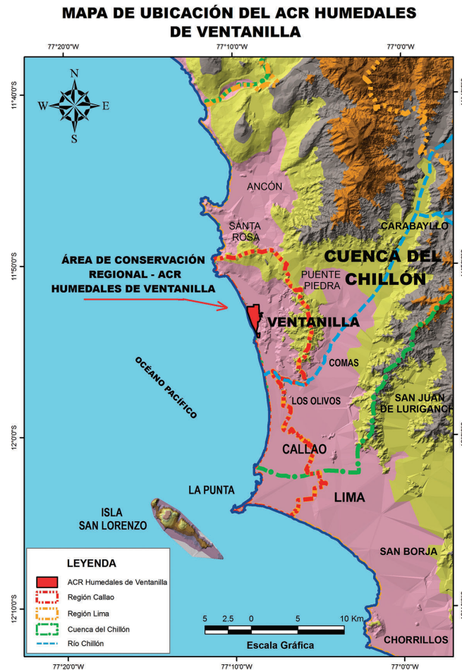
FIGURA 1. UBICACIÓN DEL ÁREA DE ESTUDIO.

Juncal (J): dominado principalmente por Schoenoplectus americanus (junco), encontrándose en ambientes inundados como lagunas, drenes, canales acuáticos y en diversos sustratos con relativa agua y en zona arenosa.