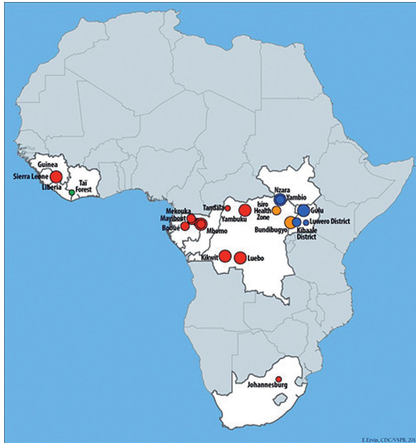
EBOLAVIRUS OUTBREAKS BY SPECIES AND SIZE, 1976 - 2014