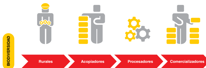
FIGURA 2. ESTRUCTURA DE UNA CADENA DE VALOR EN BIOCOMERCIO (31)

tradicional, a la alimentación sana, al reconocimiento de la importancia de la transferencia de conocimiento desde el legado cultural de nuestros pueblos, pero también de la informalidad, del engaño, de los productos milagrosos. Esta última zona gris es de responsabilidad de las autoridades competentes de fiscalización, también se debe reconocer que una reglamentación que promueva la formalidad desmotivando el emprendimiento suma a este escenario pobremente competitivo.