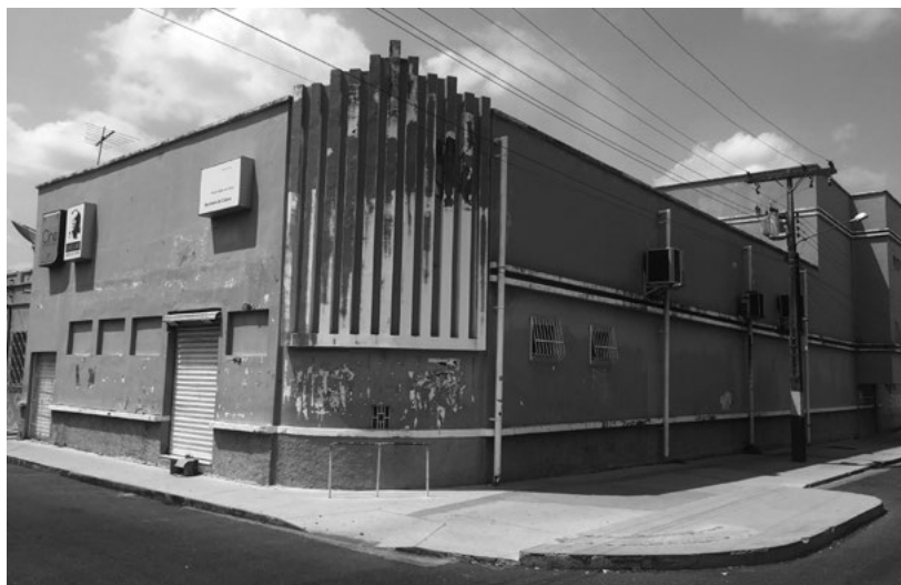
FIGURA 2. Cine Marrocos, Marabá (Pará, Brasil)