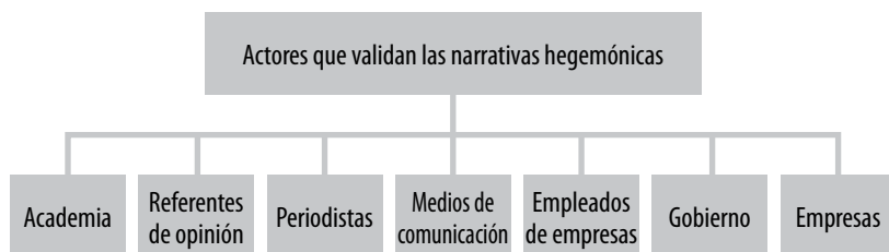
FIGURA 4. Principales actores hegemónicos. Nota. Tomado de Tejer Voces (2019).

Como se sostiene líneas arriba, existen dos narrativas en las comunicaciones construidas desde actores hegemónicos y contrahegemónicos. Se denomina «actores hegemónicos» a aquellos que «dominan el discurso dentro de las comunidades» (Tejer Voces, 2019). Según un estudio realizado por La Sandía Digital y Witness, los principales actores hegemónicos son: