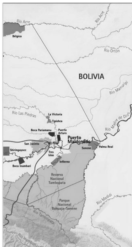
FIGURA 2. Madre de Dios, refugio de los pueblos originarios, 2020.

La comunidad nativa Ese' Eja de Palma Real, Infierno, Bahuaja y Sonene forma parte de las cuatro comunidades que componen la comunidad Ese' Eja, que, a su vez, pertenece a la familia lingüística tacana. Ellos afirman que «poco a poco trabajan por su reconocimiento después de haber sido civilizado por los dominicos en 1906». Asimismo, sostienen que «la lucha de los ese' ejas por su territorio ha sido durante siglos, desde antes del caucho. Primero con los bolivianos, después con los peruanos, los colonos, luego con la carretera, los mineros y otros» (Moore, 2018).