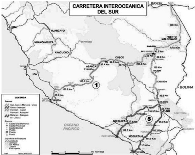
FIGURA 1. Ministerio de Transporte y Comunicaciones

De esta manera, la historia de muchas comunidades en Madre de Dios reflejan los problemas de la región y de lo que se ha vivido a lo largo de cada época de su historia. Desde la época del caucho y la shiringa, en la que muchos pueblos originarios fueron esclavizados y explotados (Chavarría et al. , 2020), hasta la época de la cascarilla o quina, a la que se siguió con la explotación de los árboles de maderas finas, castaña y otros muchos recursos que posee la región. Hoy en día uno de los problemas principales que aqueja la zona es la extracción descontrolada de oro y el narcotráfico. A pesar de todo, Madre de Dios cuenta todavía con bosques en muy buen estado de conservación, con altos valores de biodiversidad y gran diversidad de ecosistemas. Por lo tanto, tiene un potencial aliado de conservación: el ecoturismo, que ha ido incrementándose en los últimos años (Phillips, 1993; Sernanp, 2019).