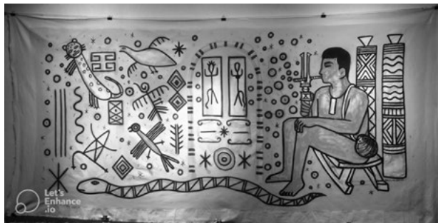
FIGURA 9. Nápirikoli.

Para Baniwa (2023), o Pajé-Onça tem o poder de acessar esses seres invisíveis. Ele seria o tradutor desse mundo, sendo autorizado a contar as narrativas mitológicas: «A onça é um desses seres que deixaram esse mundo para que o homem vivesse aqui, mas ela pode ser acessada por meio dos Pajés, tradutores desses dois universos» (Baniwa, 2023, p. 16).