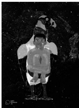
FIGURA 1. Urubu Tapuya, 2021, Infogravura, 120 × 84 cm.

Em diálogo com as obras de Baniwa, os estudos do antropólogo Eduardo Viveiro de Castro contribuirão para o entendimento dessas cosmogonias. Segundos Viveiro de Castro (2020), «o mundo é habitado por diferentes espécies de sujeitos e pessoas, humanas e não-humanas, que o apreendem segundo pontos de vista distintos» (Viveiro de Castro, 2020, p. 301), com isso, produzindo «configurações relacionais, perspectivas móveis, em suma — pontos de vista» (2020, p. 303).