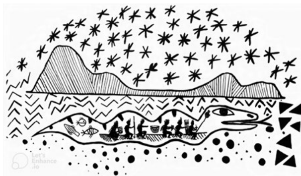
FIGURA 5. Cobra Canoa da Transformação, Infogravura, 2017.

cobra canoa, como um mundo a parte. Um dia, eles despertaram para uma enorme parede de gelo e para ser atravessada necessitou do conhecimento mágico, um bastão mágico, de cantos mágicos. Foi a avó do mundo, Yebá Buró, quem ensinou essas coisas para o Deus da terra. O Deus da terra tocou com bastão a parede e ela se rompeu. Ele precisou usar todo o seu conhecimento, quando a parede de gelo rompeu surgiu o céu azul e os mares. A navegação continuou até se transformar no mundo em que habitamos. Atravessar a parede de gelo foi a transformação. Depois de muito tempo a bordo da cobra canoa, gente peixe foi desembarcando e transformando-se em povos e clãs que habitam a terra (Krenak, 2021) 17 .