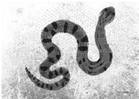
FIGURA 4. Sukuryu-tapuya , 2020 Infogravura, 84 x 120 cm.

Nota.