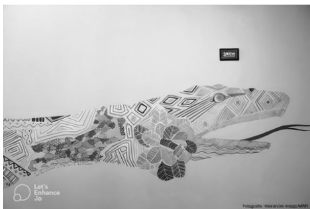
FIGURA 6. «Cobra do Tempo». 2017.

Nota. Fonte: Centro de Artes da UFF. https://www.centrodeartes.uff.br/exposicao-brasil-a-margem/