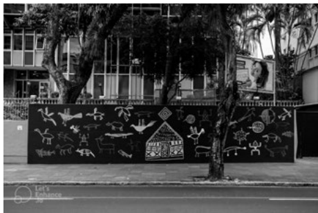
FIGURA 2. Muyerésáwa Rúka, Mural. Arte: Denilson Baniwa.

Nota. Foto: Marcelo Frey / Goethe-Institut Porto Alegre. https://www.goethe.de/ins/br/pt/sta/poa/ueb/mur.html