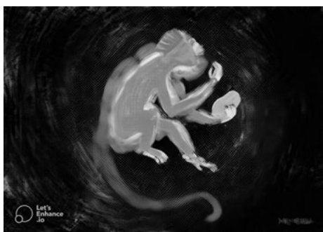
FIGURA 3. Kwatá – tapuya , 2020 Infogravura, 84 x 120 cm.

Nota. Foto: Marcelo Frey / Goethe-Institut Porto Alegre. https://www.goethe.de/ins/br/pt/sta/poa/ueb/mur.html