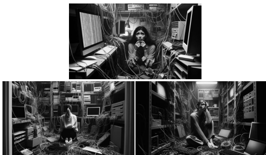
FIGURA 7. DALL-E 3: uma mulher perdida em uma sala cheia de computadores, cabos e fios