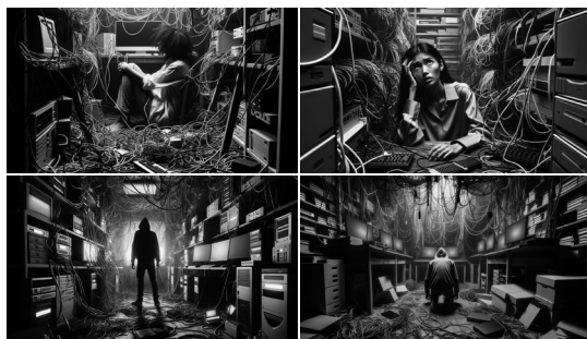
FIGURA 8. DALL-E 3: uma pessoa perdida em uma sala cheia de computadores, cabos e fios