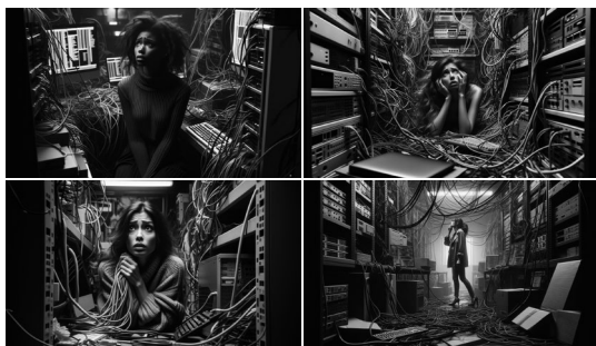
FIGURA 6. DALL-E 3: a woman lost in a room full of computers, cables and wires