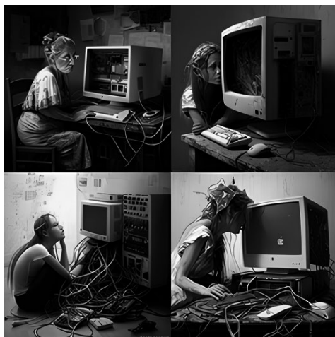
FIGURA 2. Midjourney: uma mulher perdida em uma sala cheia de computadores, cabos e fios