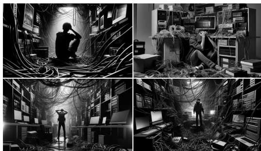
FIGURA 9. DALL-E: a person lost in a room full of computers, cables and wires

Uma questão é se precisava usar todas essas características descritivas - uma mulher branca, perdida em uma sala cheia de computadores - e qual seria o efeito do resultado sem elas. Em especial como o termo «perdida» fez a IA gerar uma atmosfera angustiante - o que corresponde ao sentimento que tive em campo naquela ocasião. A falha era nas legendas do usuário ou nas imagens e legendas da IA? Também há que considerar que este teste foi feito no começo de 2023, na versão grátis do DALL-E 2 que a OpenAI tirou e substituiu pelo DALL-E 3 pago no GPT 4. Depois disso, houve muitos progressos na criação de imagens, principalmente na diversidade e na representação de pessoas nos dados, mas com limitações. A discussão sobre esses limites parte do princípio de que a IA pode ser treinada com dados sintéticos, além dos dados reais obtidos da sociedade, que seriam feitos para refletir o que é moral e politicamente correto e socialmente justo.