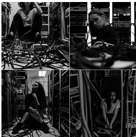
FIGURA 1. DALL-E 2: uma mulher perdida em uma sala cheia de computadores, cabos e fios

Escolhi especificar o objeto a ser gerado na imagem: «eu, uma mulher branca».³ Usei o seguinte texto de entrada ( input/prompt ) no DALL-E 2: uma mulher branca perdida em uma sala cheia de computadores, cabos e fios . O DALL-E 2 produziu a seguinte saída ( output ) com a sequência de imagens abaixo (Figura 1). Testei outra IA similar, o Midjourney na sua versão conectada ao Discord , usando o mesmo texto em português (Figura 2) e depois em inglês: a white woman lost in a room full of computers, cables and wires (Figura 3). Depois usei a mesma descrição em inglês (Figura 4) e depois em português (Figura 5), no DALL-E 3 em março de 2024. Em seguida, repeti a descrição sem especificar o adjetivo (branca) do sujeito (mulher) em inglês (Figura 6) e português (Figura 7). Depois, testei sem especificar o gênero, usando apenas a categoria «pessoa» em inglês (Figura 8) e português (Figura 9). Observe que eu não citei a «cor» da minha pele como branca e nem falei sobre o estilo de imagem, a minha idade, a cor dos meus olhos, o meu corte ou a cor do cabelo, nem a minha nacionalidade ou região.