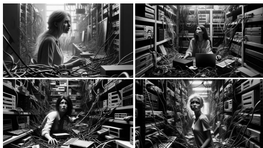
FIGURA 4. DALL-E 3: a white woman lost in a room full of computers, cables and wires