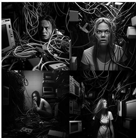
FIGURA 3. Midjourney: a white woman lost in a room full of computers, cables and wires