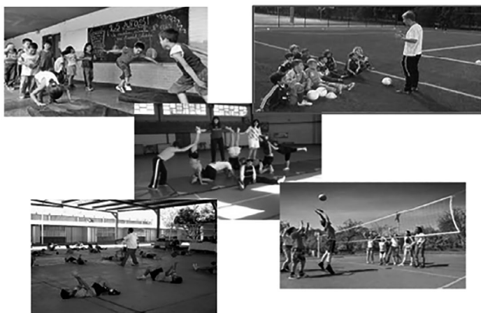
FIGURA 4. Paisaje fotográfico de la praxis de la Educación Física Nota. Elaboración a partir de las imágenes proporcionadas por los profesores principiantes.

Los narradores, profesores principiantes, recurren a su biografía escolar o experiencias anteriores para enfrentar la incertidumbre de la práctica. Reflexionan sobre las experiencias vividas y narradas, vuelven a contar sus vivencias analizando sus vidas contadas, interpretándolas de manera diferente e imaginando otras posibilidades. Llegan a concientizarse de las transformaciones de su profesionalidad y los desafíos de la profesión en el contexto contemporáneo. Reconstruyen la trama de la memoria pedagógica atravesadas por la otredad. En este punto, se implican en la investigación y en la formación como aprendiente durante el proceso de investigación. Se produce un distanciamiento de sí mismo por medio de la contextualización de las actividades que se narran, lo que supone un cruce de miradas que multiplican los sentidos posibles de la praxis educativa. Se narra lo que otros ignoran porque viven la experiencia propia como única y por tanto diferente. Estos relatos se convierten en un punto de apoyo para correr la mirada, colocarse en el lugar del otro y resignificar la experiencia colectiva. Al implicarse en la investigación, los profesores narradores se ponen a prueba para hablar de sí, aprenden a escuchar las voces de la experiencia, a cuestionar lo dicho y lo escuchado. Por tanto, resultan afectados, intelectual, afectiva y profesionalmente, en la praxis.