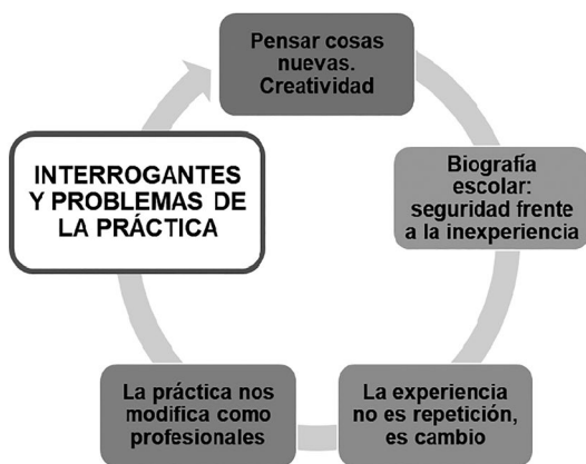
FIGURA 5. Autorrepresentaciones de los profesores principiantes

Estos aportes nos llevan a pensar en la comunidad de praxis y a ello refieren los coinvestigadores en sus respuestas a la consigna: «Nombre formas o espacios de participación que fortalecen su trabajo docente». La propuesta intentaba situarlos en un contexto colectivo en el cual coexisten diversas prácticas educativas en un escenario de transgresión y confirmación. Por tanto, algunas son aceptadas y otras cuestionadas, porque se construyen entre realidad y ficción, entre herencia e imaginación. Estos significados culturales son autorreferenciales y reclaman la instalación del debate, la confrontación y la creación para recuperar voces silenciadas y construir otros sentidos de la praxis profesional de la EF. Algunos de los que emergen en este estudio se presentan en la figura 5.