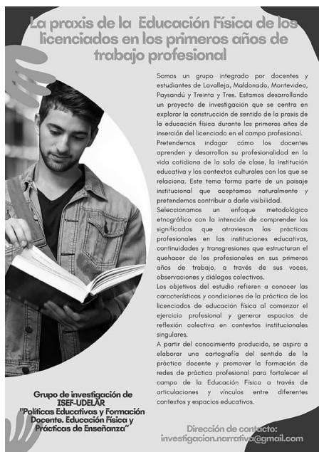
FIGURA 2. Folleto digital de difusión

convocar profesores de distintas localidades del país. En el mismo folleto se los invitaba a participar voluntariamente de la investigación y, para ello, se indicaba el enlace a un cuestionario para aportar algunas informaciones breves, que valoramos como datos primarios. Los ítems referían a años de trabajo, nivel educativo, características institucionales genéricas y localidad, donde se desempeña o se ha desempeñado como profesor, desafíos relevantes que ha tenido que enfrentar, formas como los fueron superando, datos de contacto (correo electrónico y número de celular) y, además, se solicitaba que manifestaran si querían continuar participando en la investigación. Esta primera entrada al campo significó el inicio de una relación de investigación que se profundizará y ampliará en etapas posteriores. Para este trabajo presentamos el primer acercamiento a la vida profesional de 25 jóvenes profesores de EF en Uruguay a partir del análisis de los datos aportados por sus voces.