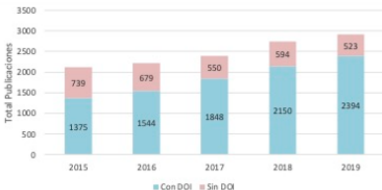
FIGURA 1. Número de publicaciones con DOI asociado y sin DOI por año

La figura 1 muestra el número de publicaciones que fueron recopiladas de 2015 a 2019 desde la base de datos Web of Science. Se observa un aumento progresivo en el número de publicaciones anuales. Aun cuando la fuente de información se acotó a dos colecciones de Web of Science que concentran las revistas de las áreas de ciencias sociales, artes y humanidades, observamos que solo el 61 % de las publicaciones se realizó en revistas relacionadas con estas áreas de investigación (tabla 1).