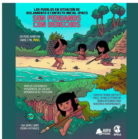
FIGURA 12. Ejemplo de formato de publicación de la SPDA en Facebook

El discurso proteccionista se basa en la defensa de la Ley PIACI y la creación de reservas indígenas para garantizar derechos y proteger la vida de los pueblos que dependen totalmente de su territorio. Textualmente, se apoya en datos oficiales y en su repetición sistemática, como muestra esta publicación de la SPDA (6 de febrero de 2023): «En nuestro país habitan aproximadamente siete mil peruanos pertenecientes a Pueblos Indígenas u Originarios que se encuentran en Situación de Aislamiento o Contacto Inicial». Este enfoque educativo, reforzado por imágenes tipo panfletos en Facebook (figura 12), refleja la estrategia de las ONG de informar a la sociedad y promover cambios de comportamiento ambiental. Como señala un entrevistado: «las comunicaciones no pueden ser solamente cajas de resonancia de las investigaciones... tienen que ser impulsores de cambios e impulsores de debate» (entrevista 1). Otro agrega: «Nosotros no somos tomadores de decisiones pero sí tenemos... la tarea de dar información para que quienes decidan puedan hacerlo de la mejor manera, de manera informada» (entrevista 3).