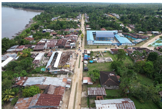
FIGURA 13. Vista aérea de Jenaro Herrera en noticia de SPDA sobre carretera que amenaza los PIACI Niota. SPDA (7 de marzo de 2024).

No obstante, la coalición discursiva proteccionista emplea un lenguaje técnico más que político, basado en normas, leyes y dictámenes, que potencia el argumento jurídico de la Ley PIACI, coherente con las áreas de conocimiento de estas ONG. Por ejemplo, en una noticia de la SPDA (7 de marzo de 2024) sobre la carretera Jenaro Herrera-Colonia Angamos como amenaza a áreas protegidas y PIACI, se citan documentos oficiales: «la deforestación producto de los trabajos de construcción de la vía fue realizada sin contar con el expediente técnico aprobado, sin certificación ambiental ni autorización de desbosque» y «no se podrá iniciar actividades en tanto no haya una opinión técnica previa favorable del Sernanp al instrumento de gestión ambiental que designe la autoridad competente». Aunque la noticia incluye varias fotos de la carretera atravesando el bosque, la primera muestra una vista aérea de Jenaro Herrera, lo que refuerza la conectividad más que la amenaza a la población (figura 13).