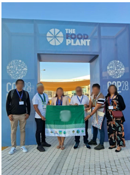
FIGURA 2. Miembros de una organización indígena en la COP28

Ahí lo tienen «posteando fotos» desde Los Emiratos Árabes Unidos, porque no les importa que se les vea el fustán... El pueblo loreto, necesita saber quiénes son, dónde andan y en qué andan (diario La Selva , 2 de diciembre de 2023).