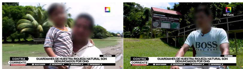
FIGURAS 9 Y 10. Miembros de la comunidad retratados como guardianes y transmisores de saberes tradicionales

En el plano audiovisual, un reportaje de Willax (11 de febrero de 2024) muestra a supuestos miembros de grupos que denominan de manejo de fauna silvestre como «guardianes de nuestra riqueza natural» (figuras 9 y 10), herederos y transmisores de saberes tradicionales que sustentan prácticas extractivistas sostenibles, ahora amenazadas por la intervención de las ONG según estos actores.