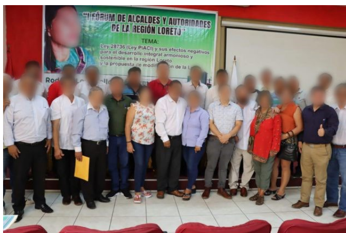
FIGURA 5. Fórum en el que se discuten los «efectos negativos» de la Ley PIACI en la región de Loreto Nota. Radio Tigre (22 de mayo de 2023).

La noticia incluye una fotografía del «I Fórum de Alcaldes y Autoridades de la Región Loreto», donde un grupo de personas aparece frente a un cartel que menciona los «efectos negativos para el desarrollo integral armonioso y sostenible en la región Loreto» (figura 5). La imagen refuerza visualmente la asociación con las autoridades locales, otorgando legitimidad institucional al discurso.