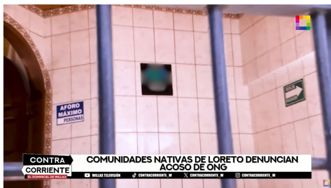
FIGURA 3. Composición visual en reportaje que acusa a ONG en Perú de intervención jurídica y política Nota. Willax (10 de marzo de 2024).

En un reportaje de Willax (10 de marzo de 2024) sobre el comercio de fauna silvestre supuestamente afectado por la intervención jurídica y política de ONG, este posicionamiento se refuerza mediante imágenes que las asocian con intrigas o prácticas criminales. El encuadre visual —detrás de las rejas de una puerta similar a una celda—, junto con una banda sonora dramática típica de programas criminales, acentúa la percepción de ocultamiento y manipulación (figura 3).