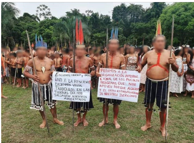
FIGURA 4. Supuestos líderes indígenas reclaman autonomía ante la supuesta intervención de ONG en el Perú

indígenas, pretenden segregar a las poblaciones originarias, condenándolas a la marginación y la pobreza extrema» (Radio Tigre, 24 de marzo de 2023). La noticia incluye una fotografía de supuestos líderes indígenas de Loreto con carteles reivindicando derechos frente a ciertas acciones de ONG, lo que refuerza el carácter colectivo y la legitimidad de las comunidades (figura 4).