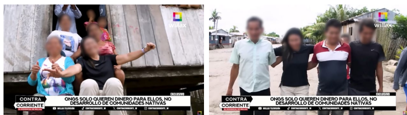
FIGURAS 6 Y 7. Recursos visuales que refuerzan la cercanía de la empresaria con la comunidad

En el plano audiovisual, la unidad se refuerza con imágenes de comunidades indígenas tomadas de la mano o abrazadas, acompañadas de sonidos de instrumentos andinos, en contraste con la supuesta interferencia de las ONG. En un reportaje de Willax (11 de febrero de 2024) sobre el comercio de fauna silvestre, se muestran imágenes de una empresaria sonriente entre miembros de la comunidad, lo que simboliza cercanía y legitimidad social (figuras 6 y 7).