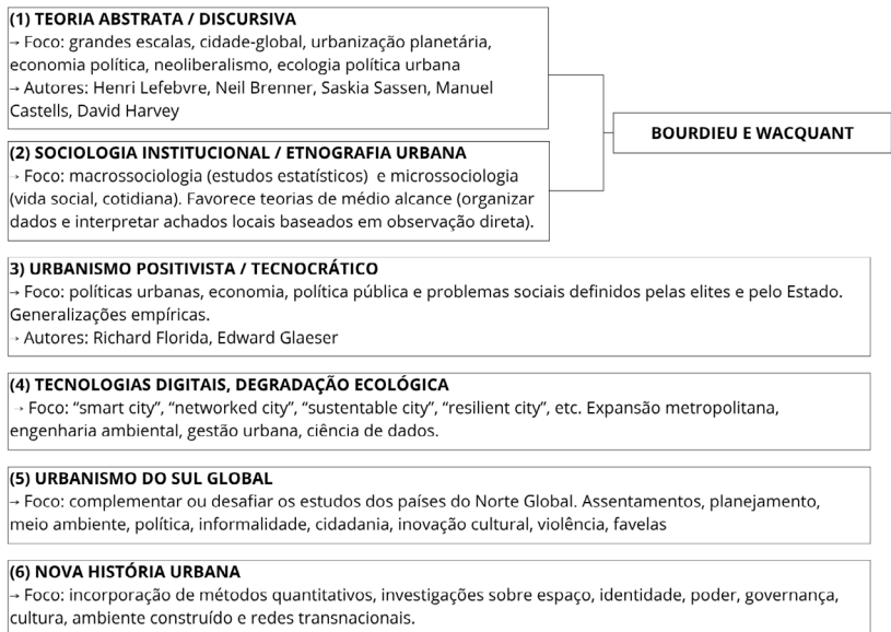
FIGURA 1. Abordagens dos estudos urbanos segundo Wacquant

«espaços sociais» que podem ser analiticamente construídos como estruturas objetivas de posições (Vandenbergh, 2010, p. 293)— podemos identificar a significativa contribuição de Bourdieu para os estudos urbanos, particularmente para o que hoje chamamos de «nova sociologia urbana», na qual o conceito de espaço é, se não central, pelo menos transversal em quase todas as referências. De fato, a partir do exercício de Wacquant (2023) de encontrar uma entrada para Bourdieu no fluxo marcado pela polarização e dispersão em seis agrupamentos de estudos urbanos, que raramente dialogam entre si, podemos visualizar a possibilidade de reconectar debates fragmentados e construir uma abordagem do urbano que considere, simultaneamente, as estruturas objetivas do espaço e as práticas cotidianas que o produzem. Embora este artigo não trate diretamente desta obra de Wacquant (2023), sua tipologia das principais abordagens dos estudos urbanos é útil para demarcar o campo no qual a interlocução teórica aqui proposta se insere, pois permite situar a contribuição bourdieusiana em uma posição estratégica entre a teoria abstrata da produção do espaço urbano e a investigação das instituições, agentes e experiências que o constituem.