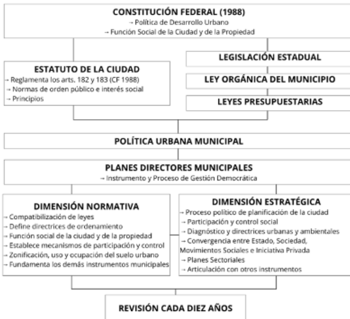
FIGURA 2. Planos directores municipales y sus dimensiones

Además de ser el instrumento básico de planificación urbana del cual todos los demás instrumentos de la política urbana «deben guardar estrecha relación y armonizarse con sus principios, directrices y normas» (Lacerda et al. , 2005, p. 56), los planes directores asumen un carácter estratégico y normativo. Como identifica Lacerda et al. (2005), este carácter es estratégico porque sus propuestas están respaldadas en diagnósticos sobre su ciudad-objeto y en el futuro deseado mediante la indicación de los medios (instrumentos, acciones y plazos) capaces de enfrentar los problemas identificados por la convergencia posible de intereses de agentes públicos y privados. Según los autores, es igualmente normativo, pues, además de formar parte de la estructura legal del Estado brasileño, también disciplina espacios, impone límites y regula la conducta de los individuos respecto al uso del suelo urbano (Lacerda et al. , 2005, p. 57).