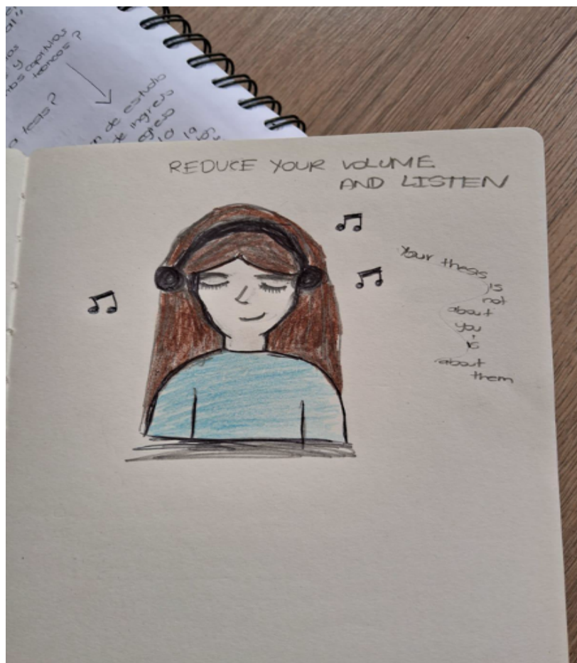
FIGURA 6. El trabajo de campo: entre sus historias y la mía (2023)

las idas y vueltas sobre la relación que manteníamos con ellos. Esto nos condujo a reformular aspectos éticos del estudio que inicialmente no habíamos previsto, lo que nos hizo dejar de preguntarnos únicamente por ¿cómo vemos a nuestros interlocutores?, ¿quiénes son ellos?, por ¿cómo somos vistos por ellos?