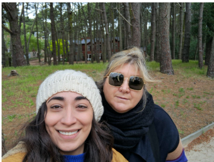
FIGURA 3. Mar de las Pampas: entre risas y el deseo de escribir como Capusotto (2023)