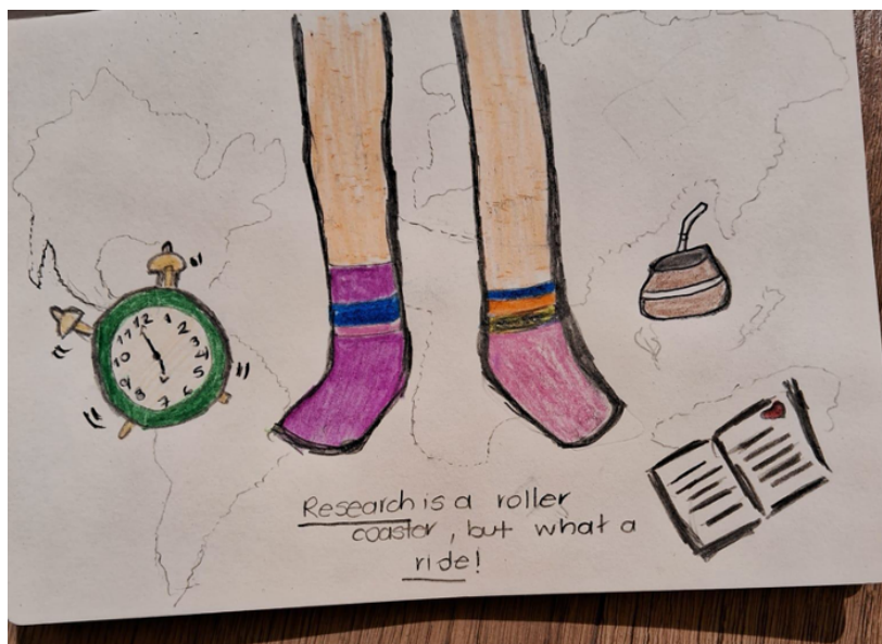
FIGURA 1. Ser investigador es parecido a estar en una montaña rusa (2023)