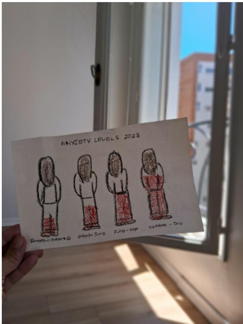
FIGURA 2. Niveles de ansiedad (2023)

el análisis de los textos me vino muy bien. Era algo que no había pensado y me ayudó un montón. En fin, aunque me haya sido incómodo al inicio, con el tiempo y después de desafiar mi ego —porque dolió, ¿eh?—, pude darle una vuelta a lo que me comentaste. Gracias (Marili, conversación informal, 7 de noviembre de 2025).