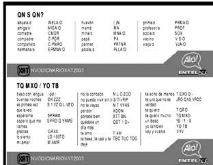
FIGURA 6. Léxico de chat (Martínez, 2004, p. 46)

En la figura 6 se puede observar la manera en que los estudiantes elaboran sus propios signos para representar a las palabras.