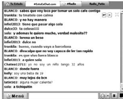
FIGURA 4. Conversación chat (Martínez, 2014, p. 58)