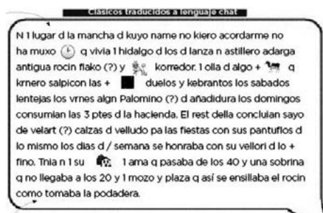
FIGURA 1. El ingenioso hidalgo don Quijote de la Mancha ( El Heraldo , 2016)

Por ejemplo, en el diario El Heraldo de Colombia se publicó uno de los fragmentos de la adaptación para smartphones de El ingenioso hidalgo don Quijote de la Mancha , que forma parte de un proyecto denominado Clásicos traducidos al lenguaje chat .