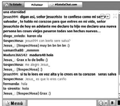
FIGURA 5. Conversación chat (Martínez, 2014, p. 61)