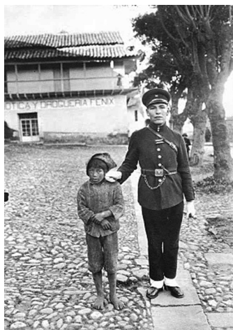
FIGURA 2. Niño vagabundo y guardia civil. Fotografía de Martín Chambi, plaza Regocijo, Cusco, 1922.

Esses decretos são indício da preocupação com a educação de órfãos e expostos revelada pela atuação de Simón Rodríguez, que também foi um menino exposto. A legislação busca responder a um problema social que tem longa duração na região: a grande quantidade de crianças de rua que se tornavam mendigos. Muitos deles se tornaram órfãos de pais vitimados pela guerra de independência, e seriam tratados, na falta de escola, como problema de polícia. Esses hospícios, portanto, além de retirar das ruas mendigos e crianças, dar-lhes-iam a educação de que até então estavam privados, transformando-os em cidadãos «úteis» para a república.