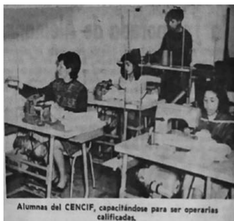
FIGURA 3. E. S. S. de G., 1971, p. 22.

La primera y la segunda razón, interrelacionadas, fueron el soporte para argumentar y justificar las condiciones laborales que rigieron a las obreras: bajas remuneraciones, mayores jornadas laborales, ocupaciones segregadas, exposición a un escenario de acoso sexual por parte de sus compañeros de trabajo y dueños de la fábrica. También nos permiten comprender la supeditación a reducidos beneficios laborales, como el seguro, la pensión, la carencia de una protección social, la poca ejecución de los derechos laborales, la precaria estabilidad laboral, las limitadas capacitaciones, las pocas oportunidades para lograr un ascenso laboral y el acceso a puestos de trabajo con prácticas desiguales y discriminatorias.