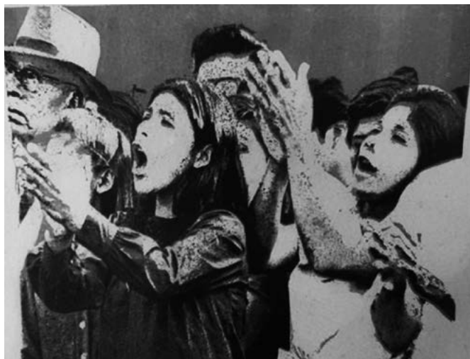
FIGURA 1. El 3 de octubre. ¡Todos a la plaza de Armas!, 1970, p. 11.

Dentro del panorama cambiante de un proceso revolucionario verdadero, las mujeres y los hombres de este país deben comprender que las formas del pasado ya no pueden seguir prevaleciendo, porque es preciso labrar un camino distinto para un futuro distinto; que esa gran injusticia del ayer, en que muchos padecieron miseria y en que pocos disfrutaron holgura, no puede continuar.