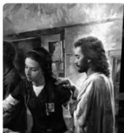
FIGURA 1. Imagen tomada de la página de Facebook The Sensei , es cuánto el 4 de mayo de 2020.

Es de Ecatepec, hija, ya mejor quítale el líquido de las rodillas.