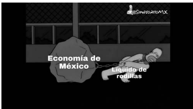
FIGURA 2. Imagen tomada del usuario de Instagram @SimpsonitoMX el 26 de julio de 2020, https://www.instagram.com/p/B_yedigjpWA/

diferenciaciones, una de clase y otra de raza, ambas hilvanadas con el humor. Ambas discriminaciones son promovidas por este meme de forma sutil entre el texto y la compasión expresada por el toque de hombro de Jesús a la doctora. El racismo silencioso (De la Cadena, 2014) que emerge en el meme es a partir de la inferioridad que se presupone a Ecatepec como región de incivilización, atada a un supuesto evolucionista que privilegia la razón, si bien el humor es en sí una práctica moral y violenta en la que siempre habrá alguien que resulte afectado por la risa del otro. En este meme, el regionalismo que soporta exclusiones de clase y raza permite generar preguntas por tipos de violencia que se naturalizan en las interacciones digitales. Esto plantearía una necesidad de mayor investigación antropológica por los sentidos de región, diferenciación y exclusión a través de medios visuales en las interacciones en línea.