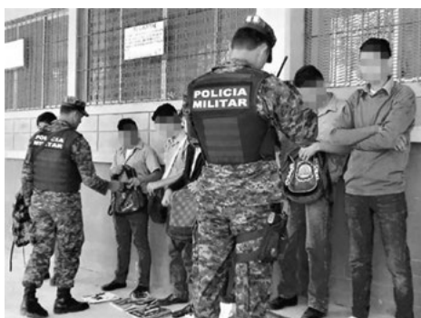
FIGURA 1. Inspecciones llevadas a cabo por miembros de la Policía Militar a lo interno de los centros educativos.

De manera paralela, resulta oportuno señalar que la extensión de un sistema educativo militarizado ha resultado en la expulsión del estudiantado considerado como problemático o que no se ajusta a sus normas. De acuerdo con la organización Casa Alianza (2016) 2 , la militarización en el país parece tener la intención de vigilar y controlar a los estudiantes. Su presencia no se enfoca en protegerlos de la delincuencia que amenaza las escuelas, sino en inspeccionar y revisar mochilas, con el pretexto de reducir el trasiego de drogas. Como resultado, aquellos vinculados a estos grupos se les expulsa.