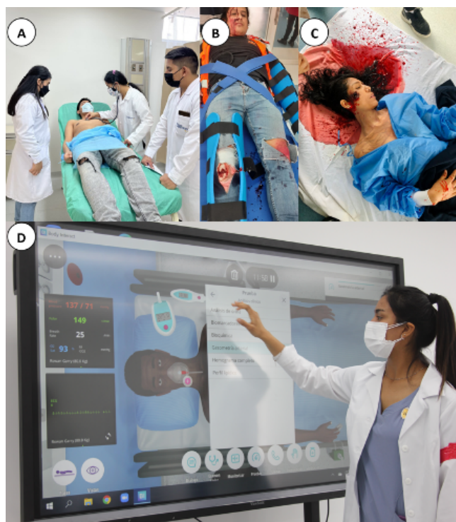
Figura 3. Empleo de diversas herramientas por parte de nuestros estudiantes de pregrado de la Carrera de Medicina Humana de la UCSUR durante las actividades de gamificación. A) capacitación para la evaluación torácica (con paciente simulado); B) y C) diversas estrategias de moulage de bajo costo para simular fracturas expuestas en paciente politraumatizado y caso de accidente por proyectil de arma de fuego; y D) uso del simulador virtual Body Interact™ para el manejo de casos de urgencia.

A lo largo de su desarrollo, el Centro de Simulación Clínica de la UCSUR ha enfrentado diversos desafíos, entre ellos la necesidad de garantizar el acceso equitativo a recursos tecnológicos, responder con rapidez a la capacitación docente en contextos de emergencia y sostener la implementación de evaluaciones estructuradas frente al incremento sostenido de la demanda estudiantil. Asimismo, la expansión a múltiples sedes evidenció limitaciones asociadas a la estandarización de procesos, mantenimiento de equipamiento y consistencia pedagógica. No obstante, estas experiencias permitieron identificar aprendizajes clave, como la importancia de contar con equipos dedicados, protocolos claros y una planificación flexible, elementos que resultan transferibles para otras instituciones que buscan consolidar centros de simulación como eje de la formación práctica.