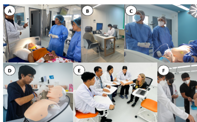
Figura 2. Actividades realizadas de forma cotidiana en el Centro de Simulación Clínica UCSUR con estudiantes de pregrado de ciencias de la salud. A) manejo del paciente politraumatizado (con paciente simulado); B) consulta simulada (con paciente simulado); C) manejo de caso complejo (con simulador de alta fidelidad); D) taller de habilidades para colocar sonda nasogástrica; E) docente realizando debriefing posterior a alguna actividad de simulación; y F) taller de habilidades para colocación de sonda vesical.

constante reinención, acompañada de la integración curricular, la investigación, la gamificación y el reconocimiento internacional, confirma su papel como referente en la innovación educativa en salud en el Perú y en la región.