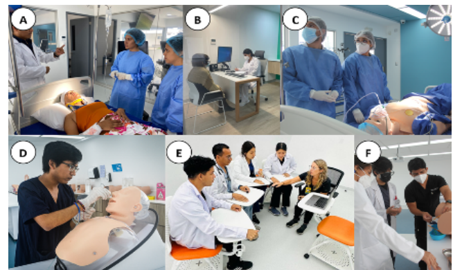
Figura 2. Actividades realizadas de forma cotidiana en el Centro de Simulación Clínica UCSUR con estudiantes de pregrado de ciencias de la salud. A. manejo del paciente politraumatizado (con paciente simulado). B. consulta simulada (con paciente simulado). C. manejo de caso complejo (con simulador de alta fidelidad). D. taller de habilidades para colocar sonda nasogástrica. E. docente realizando debriefing posterior a alguna actividad de simulación. F. taller de habilidades para colocación de sonda vesical.

constante reinención, acompañada de la integración curricular, la investigación, la gamificación y el reconocimiento internacional, confirma su papel como referente en la innovación educativa en salud en el Perú y en la región.