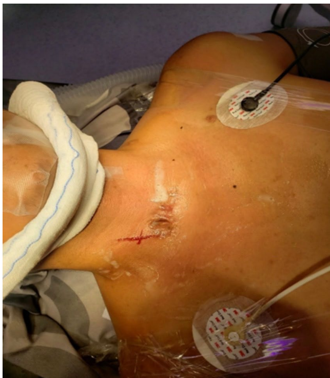
Figura 2. Abordaje quirúrgico: incisión y exposición de cuerpos vertebrales.