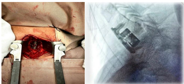
Figura 3. Colocación de cilindro de titanio y fijación con placa cervical.