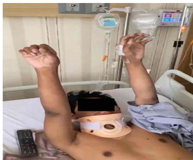
Figura 5. Paciente en recuperación con adecuada movilidad cervical y motora.

aproximadamente un año desde el evento traumático. Este comportamiento clínico resulta llamativo si se considera que múltiples estudios han demostrado que la recuperación neurológica suele correlacionarse de manera inversa con el tiempo transcurrido hasta la descompresión [10]. En la revisión sistemática de Fehlings et al. [10], la mejoría neurológica fue más pronunciada en pacientes intervenidos tempranamente; sin embargo, se documentaron casos de recuperación parcial en intervenciones tardías. De forma similar, Khorasanizadeh et al. [11] observaron que la recuperación funcional depende no solo del tiempo quirúrgico, sino también de la extensión de la lesión inicial y de la descompresión completa del canal medular. En este contexto, la recuperación casi inmediata observada podría explicarse por la persistencia de compresión mecánica residual susceptible de reversión tras la liberación quirúrgica.