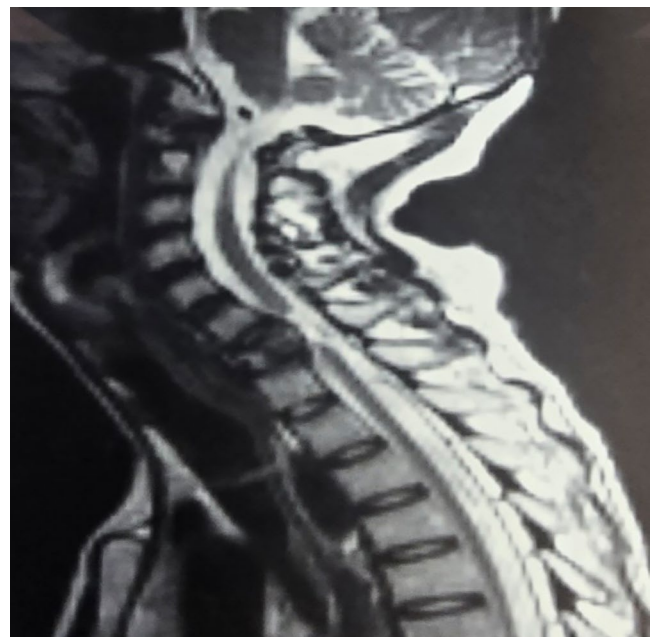
Figura 1. Tomografía Axial Computarizada (TAC) de columna cervical pre-quirúrgica (compresión severa y fractura en C6-C7).

El postoperatorio inmediato mostró mejoría neurológica significativa, con fuerza 5/5 en miembros superiores y 4/5 en inferiores. La radiografía de control evidenció correcta alineación y osteosíntesis (Figura 4). El paciente fue dado de alta al tercer día, con rehabilitación física progresiva (Figura 5).