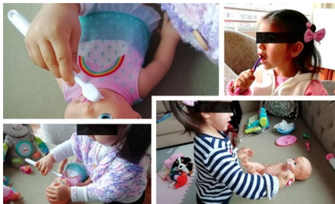
Figura 1. Niña jugando en casa a limpiar sus dientes, aprendiendo en tiempos de pandemia, supervisado por un odontopediatra a través de videollamada

Se recomienda a los odontopediatras enviar un kit preventivo a casa de los pacientes de riesgo que requieren controles periódicos, el cual debe incluir pasta dental con una concentración de flúor (mínimo 1000 ppm) de acuerdo con el riesgo de cada paciente, un cepillo