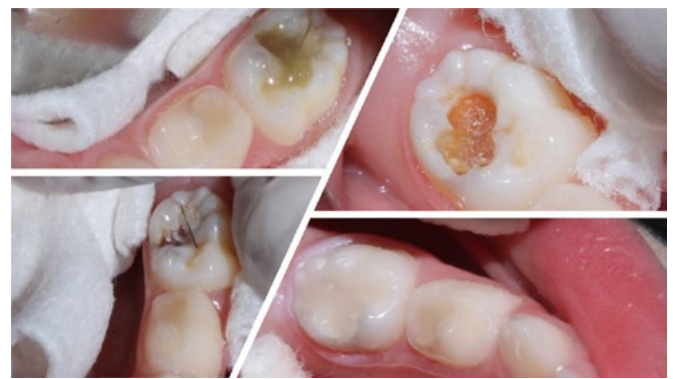
Figura 5. El uso de los removedores biológicos de dentina infectada evita el uso de aerosoles.

En la etapa de recambio dental, hay muchas veces movilidad dental y retención del diente deciduo a exfoliar. Se debe instruir a los padres acerca de que no es necesario ir al consultorio, a menos que el niño tenga muchas molestias, por lo que se debe calmar e incentivar a consumir alimentos como frutas o verduras para acelerar el proceso de exfoliación. Otra manera de ayudar a exfoliar un diente deciduo será colocando una liga separadora de ortodoncia a nivel del borde cervical del diente; esta técnica ayudará a que el diente exfolie rápidamente sin necesidad de que el odontopediatra deba extraerlo (figura 6).