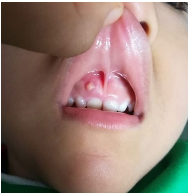
Figura 13. Foto enviada por madre, consulta sobre «bultito» que encontró en la boca del niño, no hay dolor ni molestias. La recomendación es solo controlarlo hasta que pueda asistir al consultorio.