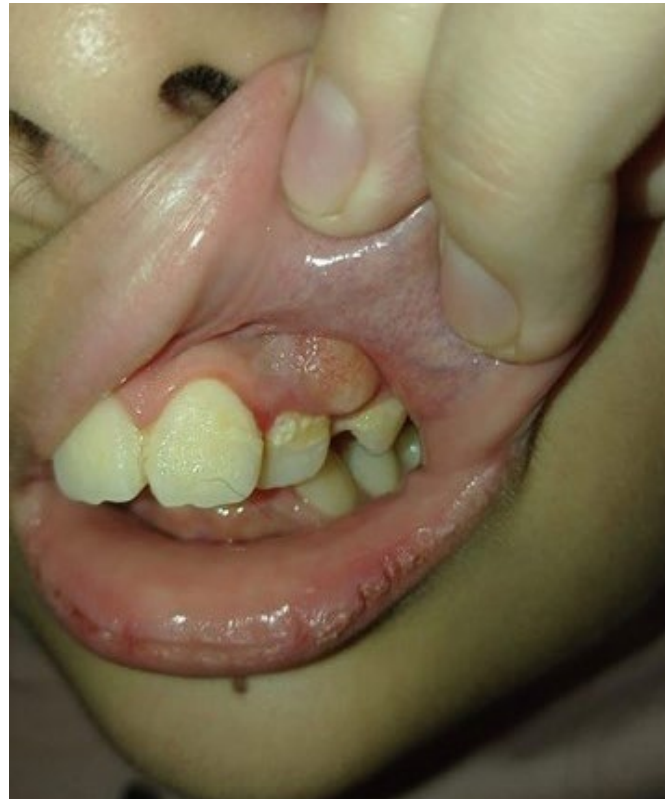
Figura 14. Foto enviada por madre. Consulta sobre hinchazón dura observada en la boca de su niña, no hay dolor ni molestias. La recomendación es controlar hasta que pueda asistir al consultorio. Se trata de la erupción de un premolar y hay poco espacio, por lo que va a requerir tratamiento de ortodoncia. Mejorar y controlar la higiene dental..