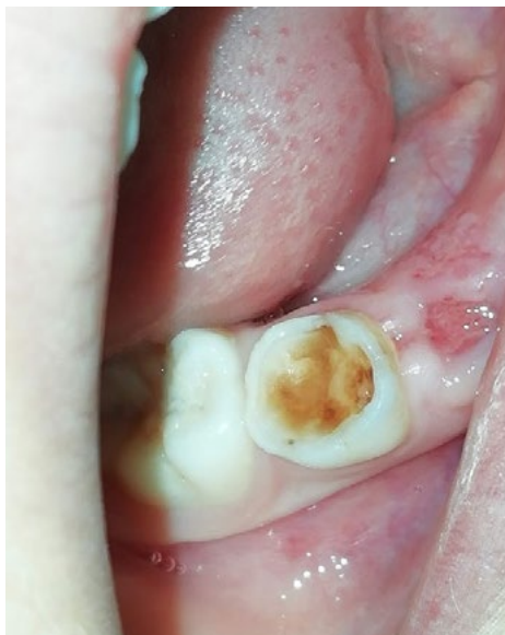
Figura 3. Pérdida de restauración

Las lesiones de caries dental sin compromiso pulpar se pueden manejar con aplicación del fluoruro amino de