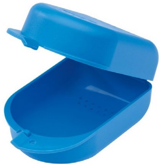
Figura 8. Portaretenedor de plástico