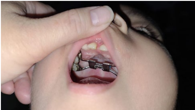
Figura 12. Orientación por videollamada para ajustes de aparatología de ortodoncia