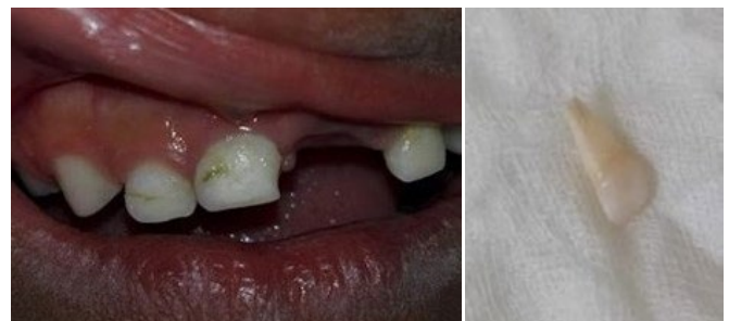
Figura 15. Madre envía foto de avulsión completa de diente deciduo, no requiere atención presencial, solo orientación.

permanente del diente, luxación severa, fractura de la raíz y corona, fractura de corona complicada) (figura 16).