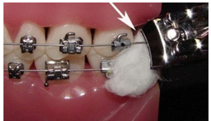
Figura 11. Porción distal de arco suelta, se puede cortar y colocar cera de ortodoncia.