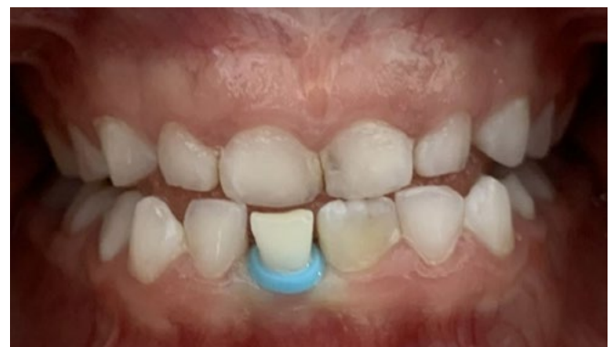
Figura 6. Liga separadora como ayuda para exfoliación de diente deciduo