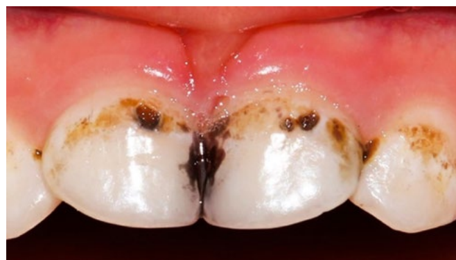
Figura 4. Uso del fluoruro amino de plata como control de la progresión de lesión de caries

plata hasta que se pueda asistir al consultorio en forma regular, y evitar en todo momento el uso de elementos rotatorios de alta velocidad con emisión de aerosol, aplicar la odontología de mínima invasión (figura 4).