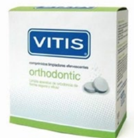
Figura 9. Pastillas efervescentes para limpieza de retenedores