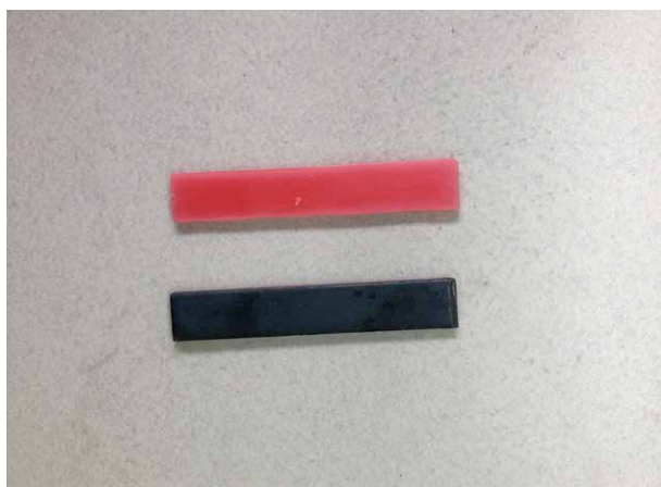
Fig. 1. Matriz metálica

Prueba de comparaciones múltiples de Tukey