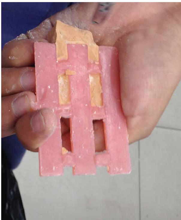
Fig. 6. Retiro de las láminas de resina acrílica del yeso