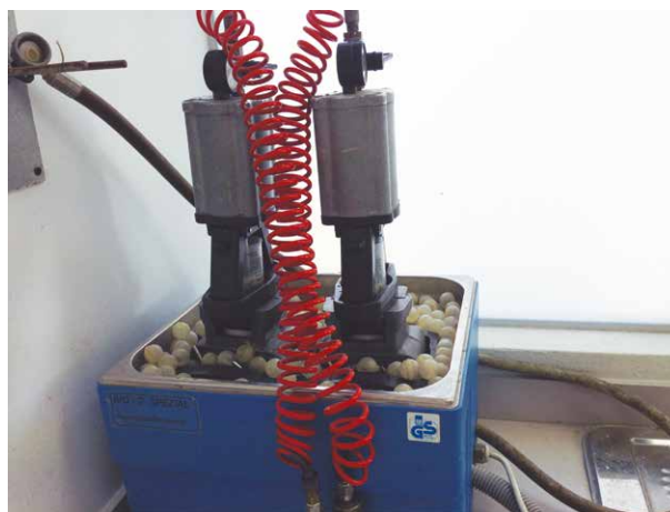
Fig. 4. Sistema de procesado de SR Ivocap® (Ivoclar)