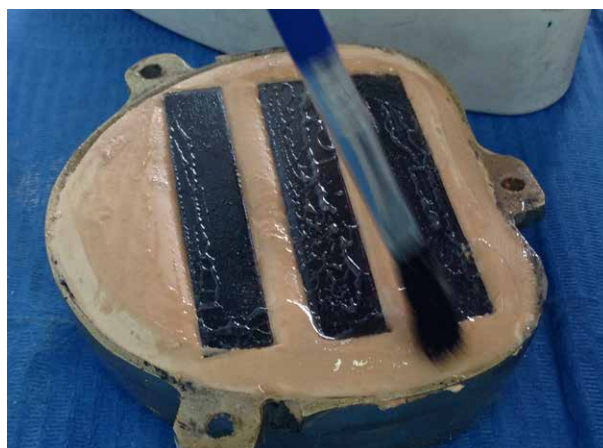
Fig. 3. Aplicación de la primera capa de aislante para yeso