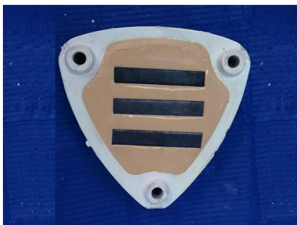
Fig. 2. Enterrado de las matrices metálicas en el yeso