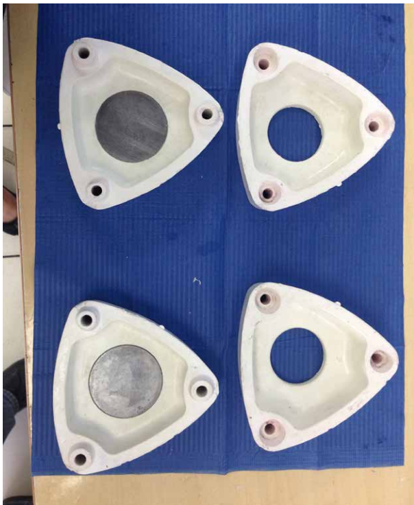
Fig. 5. Mufla de resina de fibra de vidrio especial para microondas "VIPI STG"