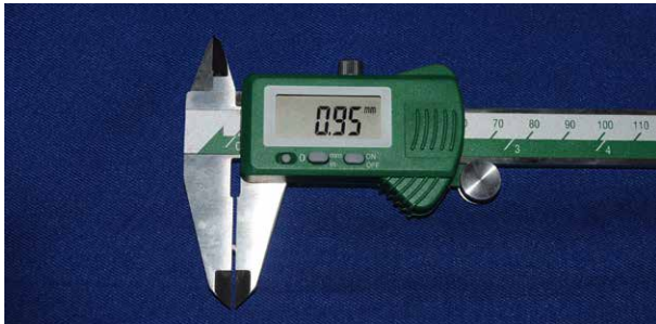
Fig. 6. Medición del área de la interfaz

constante. Los especímenes presentaron una área transversal de aproximadamente 1mm 2 medido con un vernier digital (Insize CO, LTD) (Figura 6). Los especímenes que presentaron algún tipo de falla fueron descartados conservándose finalmente 30 por grupo, los cuales se almacenaron en tubos rotulados con el nombre del grupo al que pertenecían.