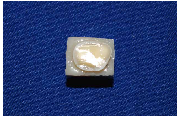
Fig. 1. Exposición de la dentina de la tercera molar

Fueron utilizadas 27 terceras molares extraídas en un periodo no mayor a 4 meses y por motivos ajenos al presente estudio. Las molares fueron limpiadas de restos orgánicos y almacenadas en Timol al 0.1% a 4°C; 24 horas antes del procedimiento, se mantuvo en agua destilada a temperatura ambiente. Las raíces de las piezas dentarias fueron sumergidas en resina de autocurado hasta 1mm antes del límite amelocementario. El esmalte oclusal se removió con un disco diamantado montado en un mandril y colocado en un micromotor bajo irrigación constante del agua proveniente de la jeringa triple; para garantizar la remoción completa del esmalte y dejar la superficie plana y lisa, se pulió la superficie dentinaria con lija de papel de agua número 280, 600 y 1000 también bajo irrigación constante (Figura 1). Se dividieron