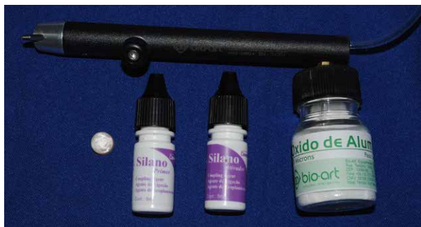
Fig. 3. Disco de resina arenado y silanizado

En una platina de teflón de 10 x 10cm y de 4mm de espesor se realizaron 9 perforaciones circulares de 10mm de diámetro, los cuales se emplearon como moldes en la preparación de los bloques de resina compuesta Solare (GC Corporation Tokio, Japón). Dentro del molde se colocaron incrementos similares de resina que fueron fotocurado por 30sg. cada uno con una lámpara LED (Kavo Saguacu Jownville, SC, Brasil). Cada disco se lija para asegurar una superficie lisa y fue arenado con partículas de óxido de aluminio de 50µm por 10sg., se aplicó una capa fina de silano (Dentsply, Petropolis RS, Brasil) y se secó cuidadosamente con aire libre de humedad y aceite y se repitió una vez más dicho procedimiento (Figura 3).