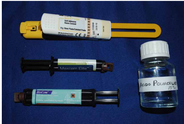
Fig. 2. Materiales utilizados en el estudio

las piezas dentarias aleatoriamente en 9 grupos de acuerdo a los materiales empleados en el estudio y al tiempo de aplicación del ácido poliacrílico (APA) al 15% sobre la dentina, cada grupo estuvo formado por 3 piezas dentarias. Los cementos resinosos autoadhesivos evaluados fueron Maxcem Elite (Kerr; Orange, CA, USA), Biscem (Bisco; Schaumburg, IL, USA), RelyX U200 (3M ESPE; St Paul, MN, USA) (Tabla 1 y Figura 2).