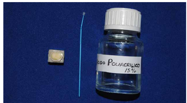
Fig. 4. Dentina acondicionada con APA al 15%

Basándose en la composición de los acondicionadores de dentina disponibles solo en el mercado internacional (Tabla 2), se preparó una solución de 10ml de ácido poliacrílico a una concentración del 15%; dicha preparación, estuvo a cargo de una química farmacéutica. Con la ayuda de un microbrush y empleando la técnica de frotado se aplicó el ácido poliacrílico al 15%, el tiempo de duración dependió del grupo al que perteneció la pieza dentaria (Tabla 3), se enjuagó la dentina por 30sg. y el exceso de agua fue absorbido con papel tisú (Figura 4). Para todos los grupos el cemento resinoso autoadhesivo fue aplicado sobre la dentina en un espesor de 1mm aproximadamente, se colocó el disco de resina y se ejerció una presión constante empleando una pesa de 1kg por 3min, fue fotocurado 30s cada lado de la muestra con una lámpara LED Kavo de 600mw/cm 2 de potencia (Figura 5). Cada muestra se almacena en un recipiente herméticamente cerrado con agua destilada por 24 horas a temperatura ambiente.