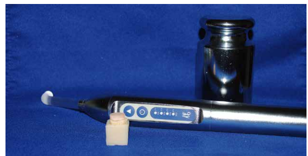
Fig. 5. Cementación del disco sobre la dentina acondicionada