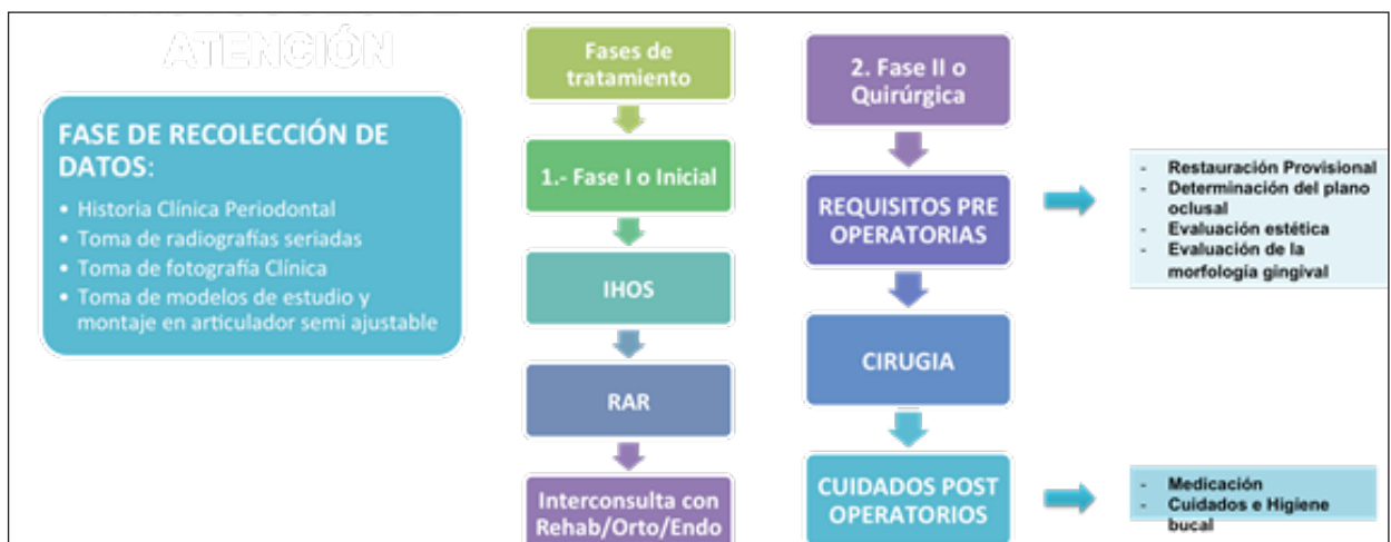
Figura 2: Esquema de Invasión de Espacio Biológico realizado en el Posgrado de Periodoncia e Implantes UCSUR.