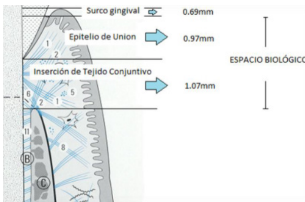
Figura 1: Esquema de los componentes del espacio periodontal y sus medidas según Gargiulo y Vacek.

Las dimensiones de la anchura biológica no están estandarizadas pues varían entre individuos, con la edad (su longitud disminuye con la edad), con la posición del diente en la arcada (mayor longitud en sectores posteriores) o con el biotipo periodontal, aunque permanecen constantes en las distintas superficies del diente 10 . En el año 2013 Julia Schmidt y cols, realizan una revisión sistemática y metaanálisis al respecto en la cual encuentran una variabilidad significativa intra e interindividual en las dimensiones del espacio biológico. Por lo que no existen dimensiones universales del espacio biológico, pero encontraron valores promedio de 2.15 a 2.30mm. 1