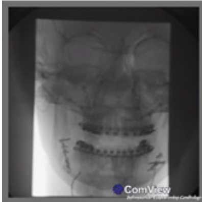
Fig. 2a Movimientos dinámicos.