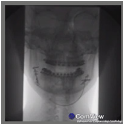
(Fig. 3a) Ausencia de colección sanguínea.

Asimismo se descarta cualquier tipo de colección sanguínea y osteotomías en posición (Fig. 3a y Fig. 3b)