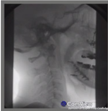
Fig. 2b Imagen de llenado vascular derecho.

Asimismo se descarta cualquier tipo de colección sanguínea y osteotomías en posición (Fig. 3a y Fig. 3b)