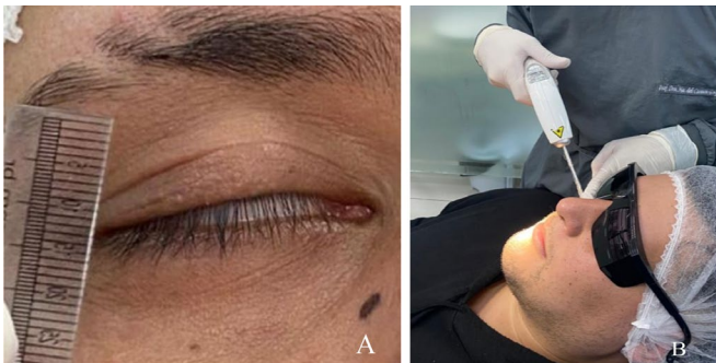
Figura 2. A) Medición del distanciamiento palpebral. B) Aplicación del láser en la curvatura malar.

El láser se configuró en la misma frecuencia para todas las sesiones: 4 julios para aplicación en 4 puntos siguiendo la curvatura del malar cada 1 cm. Antes de la aplicación del láser, se realizó la medición del distanciamiento palpebral, que fue de 3 mm (figuras 2a y 2b).