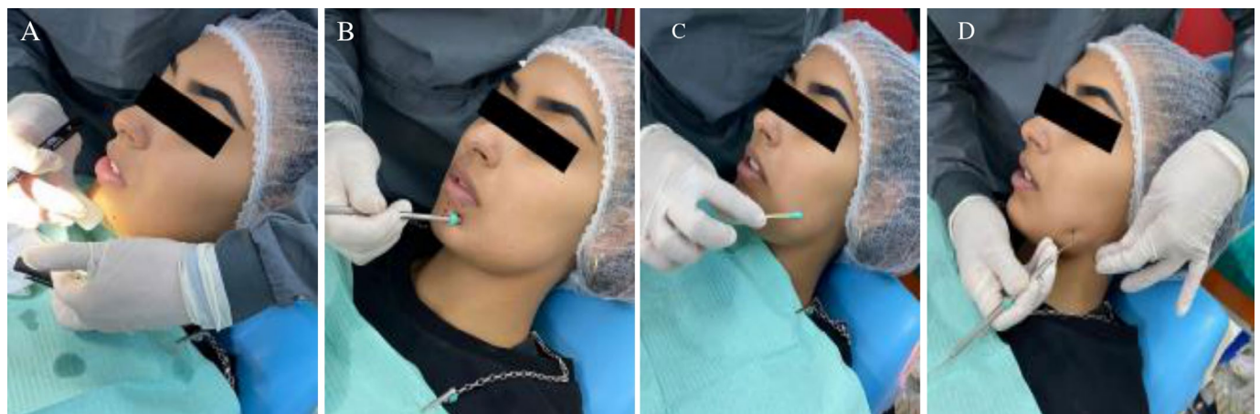
Figura 6. Pruebas térmica y mecánicas realizadas. A) Prueba con frío. B) Prueba con el mango del espejo. C) Prueba con un hisopo. D) Prueba con la punta de la sonda exploradora.

En el campo odontológico, puede ocurrir la pérdida de la función sensorial o motora de los nervios de la región facial, como resultado de ciertos procedimientos odontológicos. Esto puede generar alteraciones importantes para los pacientes, con diversos grados de disfunción (8) .