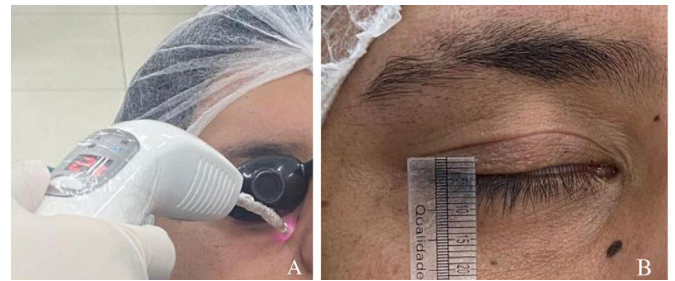
Figura 4. A) Aplicación de última sesión de láser. B) Cierre total palpebral en reposo.

En la quinta y última sesión se observó una distancia palpebral de 1 mm. El paciente refirió haber recuperado la sensibilidad alrededor de la zona palpebral, se corroboró que este pudo realizar el cierre con un ligero esfuerzo, pero aún no consiguió el cierre total del párpado en reposo; por ende, se sugirió el seguimiento clínico (figuras 4a y 4b).