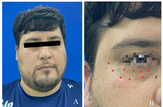
Figura 1. Fotografías extraorales. A) Fotografía de frente donde se evidencia falta del tono muscular del lado derecho. B) Zona de afectación: orbicular y palpebral inferior.

En la exploración clínica extraoral, se evidenció la pérdida del tono muscular de toda la zona facial derecha, la falta de sensibilidad a nivel orbicular y palpebral inferior, y una baja función motora, lo que dificulta al paciente el cierre ocular, con esfuerzo y en reposo, así como sonreír, realizar gestos y parpadear, lo que ocasiona sequedad ocular (figuras 1a y 1b).