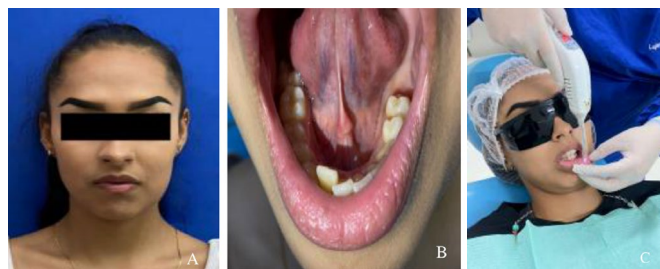
Figura 5. A) Fotografía extraoral donde se percibe un ligero abultamiento facial en el lado izquierdo. B) Fotografía intraoral donde se observa la ausencia de piezas dentarias y la disminución del reborde alveolar izquierdo. C) Aplicación de láser en las zonas afectadas.

Se procedió a realizar el tratamiento con láser de baja potencia en las siguientes zonas afectadas: la zona del trigémino, en 3 puntos, con una densidad de energía de 2 julios; el área del mentoniano, en 9 puntos, con una densidad de energía de 3 julios; y la mucosa del labio, en 4 puntos, con una densidad de energía de 2 julios y una distancia de 3 cm entre punto y punto. El tipo de contacto fue perpendicular y la emisión, continua (figuras 5a, 5b y 5c).