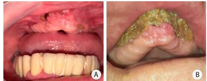
Figura 1. Fotografías intraorales. A) Secuestro óseo maxilar bilateral, el cual se manifiesta mediante múltiples trayectos fistulosos. Estos se presentan de forma simétrica y comprometen una extensa porción del tejido óseo maxilar. B) La evolución crónica y la progresión de la osteomielitis maxilar han desencadenado la formación de una lesión de secuestro óseo de gran magnitud. Esta lesión abarca más del 50% de la estructura ósea del maxilar.

2c) donde se observaron abscesos cerebrales en la región frontal izquierda (corte RM: 37/60) en fase capsular tardía, con discreto edema cerebral vasogénico periférico, correlacionando con los resultados de los análisis microbiológicos.