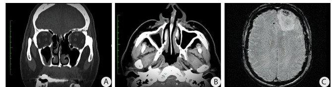
Figura 2. Imágenes radiológicas iniciales. A) Engrosamiento de la pared basal del seno maxilar derecho con disminución del segmento óseo relacionado con el maxilar superior, comunicación oro sinusal en la pared basal del seno maxilar izquierdo. Tomografía axial computarizada. B) Se evidencia presencia de líquido acumulado en el seno maxilar izquierdo, con disminución de la pared medial. C) Abscesos cerebrales en región frontal izquierda en fase capsular tardía, con discreto edema cerebral vasogénico periférico. Realce paquimeníngeo y leptomeníngeo generalizado.