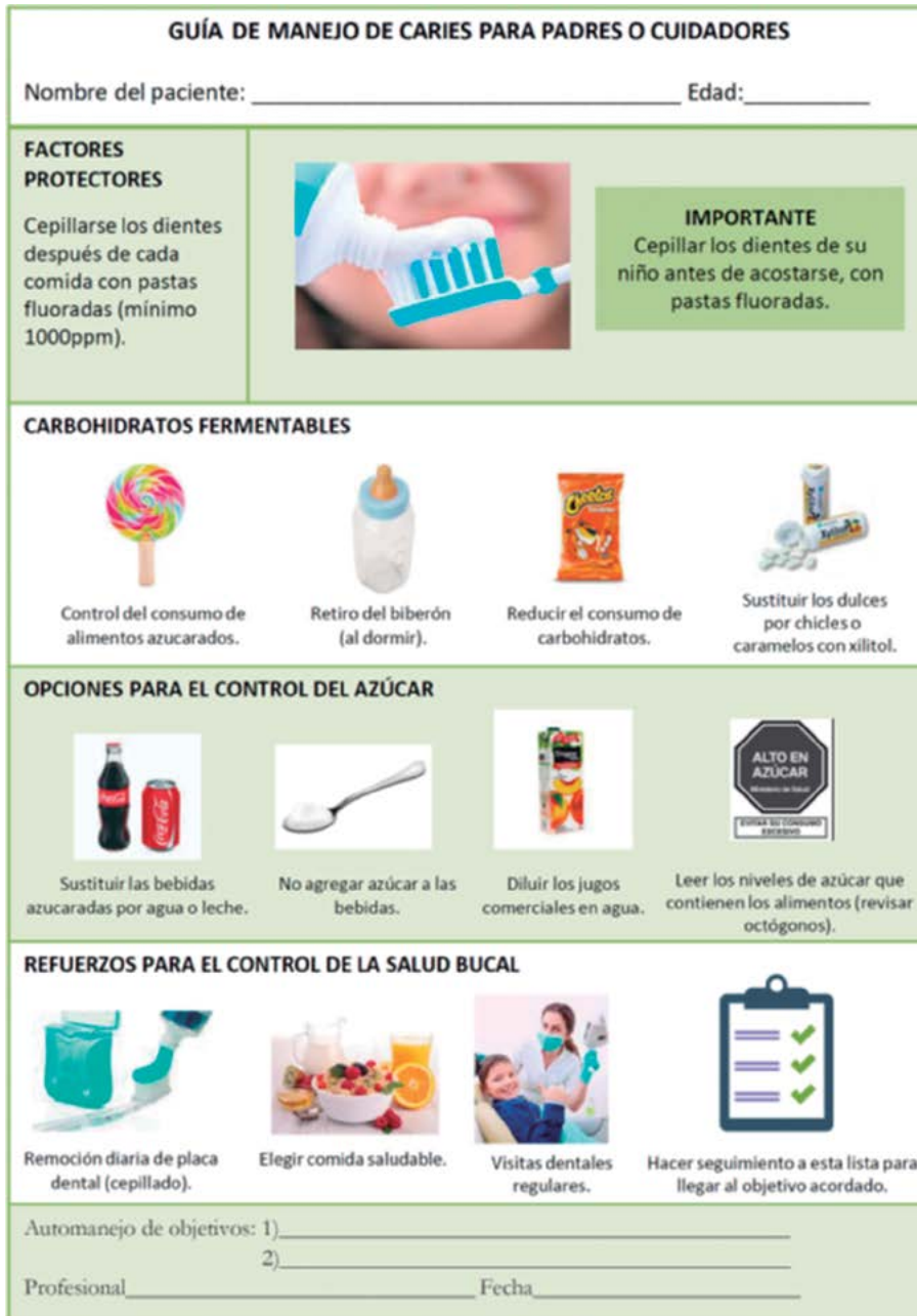
FIGURA 3. COMPROMISO DE LOS PADRES. TOMADO Y MODIFICADO DE RAMOS GÓMEZ ET AL. (12) Y FEATHERSTONE ET AL. (15)

tables, las opciones para el control del azúcar y los refuerzos que deben tener en cuenta para el cuidado de la salud bucal de su niño. Se resalta, además, la importancia del cepillado con pastas fluoradas (mínimo 1000 ppm) antes de acostarse.