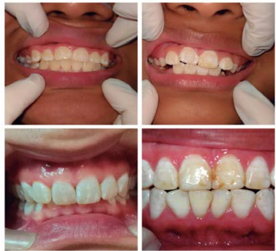
Figura 6. Índice de Dean: normal, cuestionable, muy leve, leve, moderado y grave