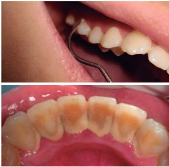
Figura 1. Examen índice de higiene oral: placa bacteriana y placa calcificada

Se consideró como variables del estudio la placa bacteriana, la enfermedad periodontal, la caries dental, la maloclusión, la fluorosis, la edad y el sexo. El método utilizado fue el observacional estructurado; como técnica, el examen clínico. Para la recolección de datos se empleó una ficha preparada especialmente para este trabajo.