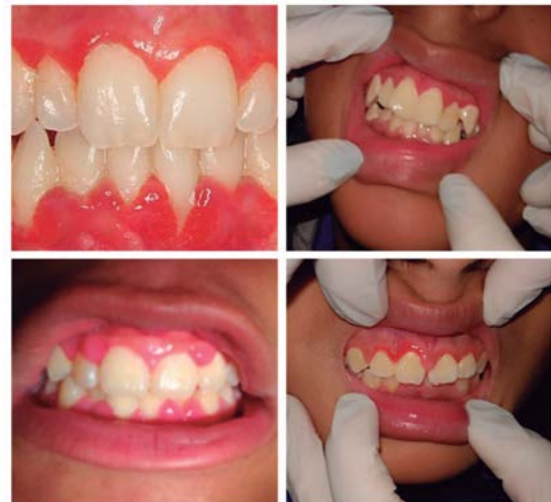
Figura 3. IPCM: gingivitis

Para el análisis univariado, se empleó estadística descriptiva, se tomaron frecuencias absolutas y porcentuales para cada una de las variables, las que fueron llevadas a una tabla de frecuencias para cada una de ellas, respectivamente. Para el análisis bivariado se determinó la asociación a partir de la prueba de chi cuadrado y t-Student de todas las variables principales con la edad y género de la muestra en estudio. El vaciado de los datos se realizó en el programa Microsoft Excel y se analizaron