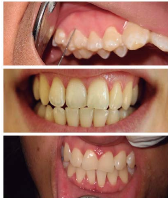
Figura 2. IPCM: persona sana, persona con enfermedad periodontal (15 años)

Como paso previo al desarrollo del estudio, la investigadora fue calibrada en un nivel gold estándar para una mejor obtención de los datos. El examen de los participantes se realizó en las primeras horas de clase para evitar el contacto con los alimentos. Para la evaluación de la placa bacteriana, se utilizó el índice de Green y Vermillion simplificado (IHO-S) y, para la dentición decidua, la modificación de Miglani, Beal, James y Behari (IHOS-M) (figura 1) (17). La evaluación de la enfermedad periodontal se realizó mediante el índice periodontal comunitario modificado (IPC-M). Se evaluó la presencia o ausencia de sangrado gingival y bolsa periodontal utilizando una sonda periodontal Hu Friedy-OMS, y se observó la recomendación de no realizar el sondaje para medir la profundidad de bolsa en niños menores de 15 años (figuras 2 y 3). Para la caries dental, se aplicó el índice de ceod de Gruebbel y CPOD de Klein y Palmer, mediante letras para los dientes deciduos y números para los permanentes (figura 4). Para las maloclusiones, se utilizó el índice de la OMS (figura 5) y, para la fluorosis dental, el índice de Dean (figura 6) (19,20).