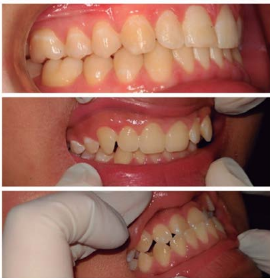
Figura 5. Índice de maloclusión de la OMS: normal, leve y moderado

los resultados mediante el paquete estadístico SPSS versión 21.