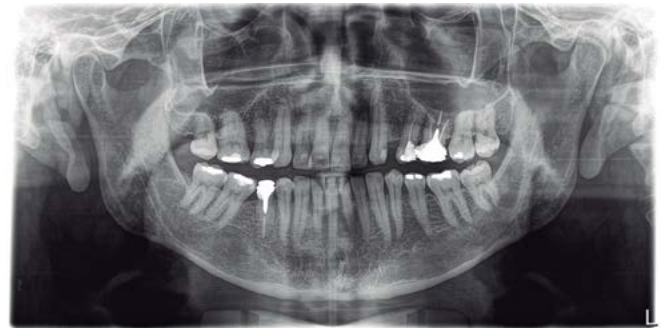
Figura 3. Radiografía panorámica.