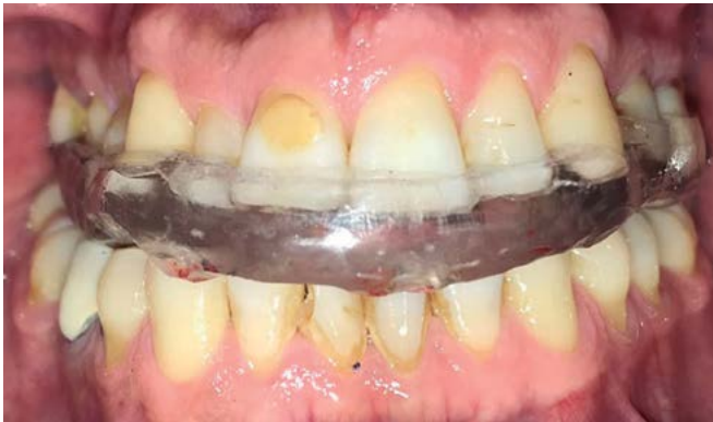
Figura 5. Férula dental instalada.

de oclusión ideales, mediante el uso de papel articular. Al paciente se le indicó el uso nocturno (fig. 5).