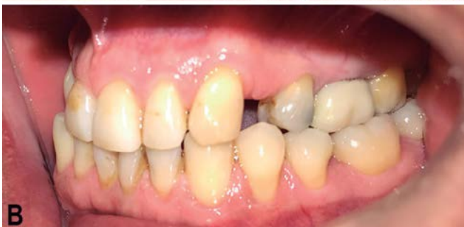
Figura 2. Fotografías intraorales. A) Vista lateral derecha. B) Vista lateral izquierda.