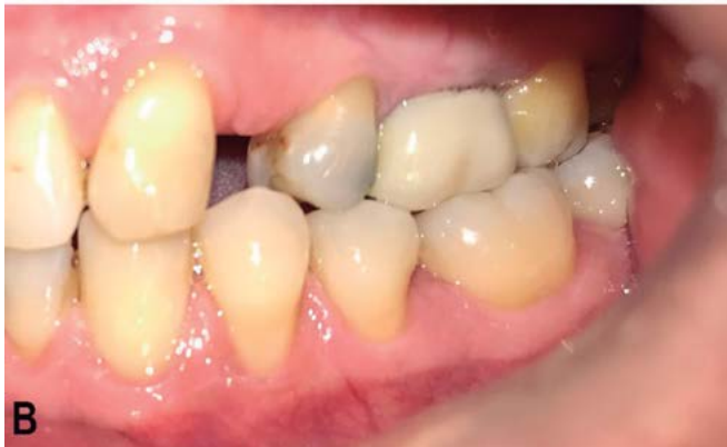
Figura 1. A) Fotografía intraoral inicial que muestra mordida invertida de las hemiarquadas derecha. B) Recesión gingival en las piezas 3.4 y 3.5.