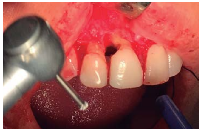
Figura 4. Eliminación del tejido remanente

Posteriormente, se aplicó ácido fosfórico en las zonas de reabsorción para el grabado de la zona durante 15 segundos, se lavó y se retiraron los excesos de humedad para la colocación del adhesivo universal 3M fotocurado durante 20 segundos. El ionómero del sistema Geri®, en su presentación de jeringa doble, fue el empleado para la reconstrucción, aplicado por medio de su punta de automezclado en las superficies preparadas (figura 6). Se evitó el contacto entre las estructuras dentarias con cinta