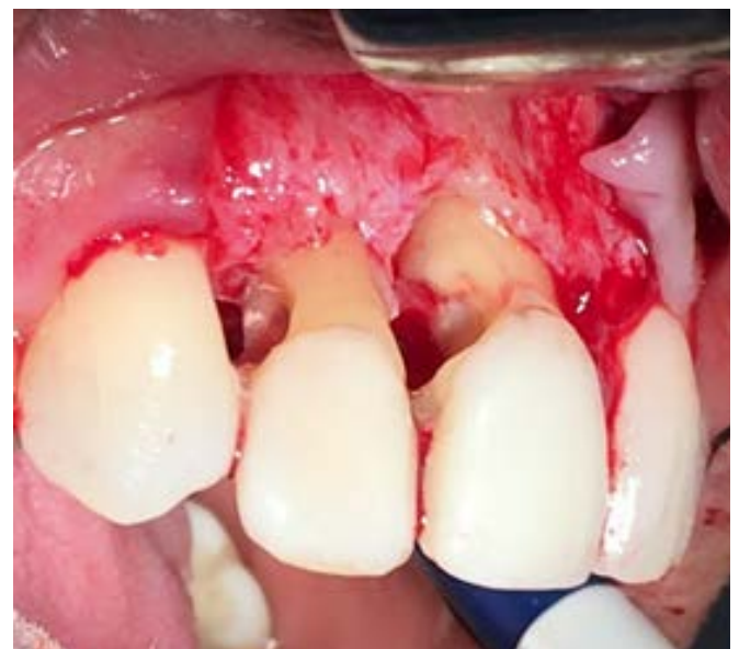
Figura 5. Exposición de la reabsorción