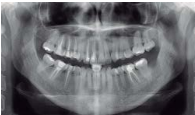
Figura 2. Radiografía Panorámica