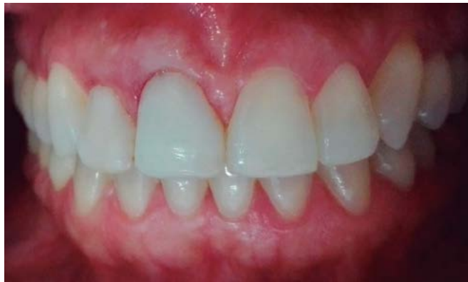
Figura 1. Fotografía clínica intraoral inicial

por medio de una fresa redonda mediana, sobre las cavidades formadas por la reabsorción (figuras 4 y 5).