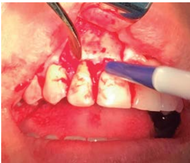
Figura 3. Levantamiento de colgajo

Durante el procedimiento, se llevaron a cabo lavados con suero fisiológico y se consiguió la hemostasia realizando presión por medio de bolitas de algodón estéril.