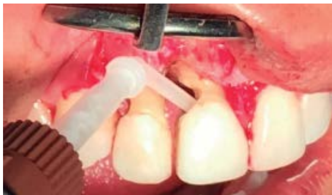
Figura 6. Colocación del material de reconstrucción