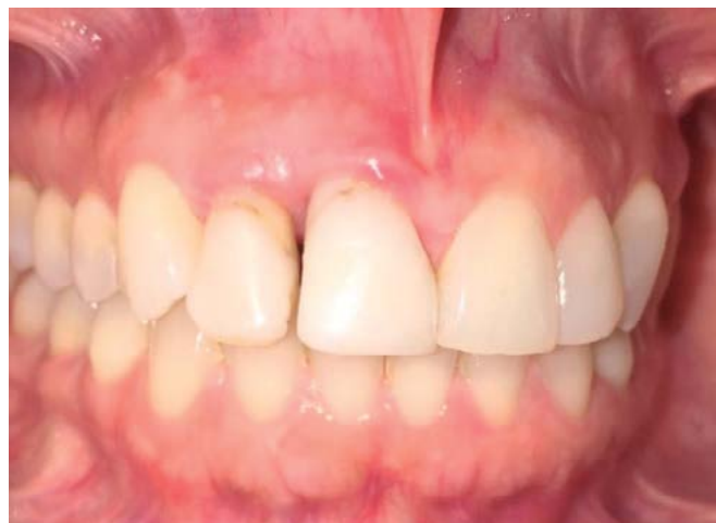
Figura 8. Fotografía clínica intraoral al mes de control