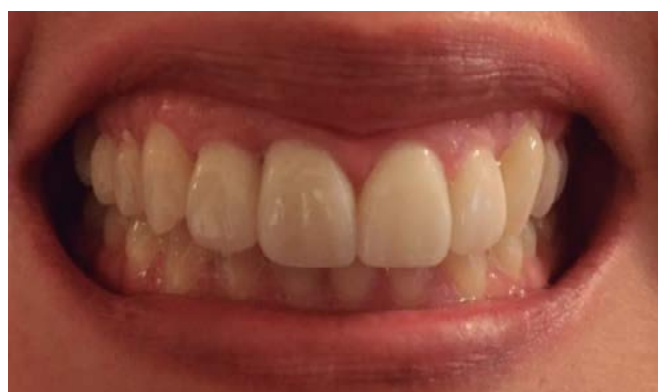
Figura 9. Fotografía clínica intraoral a los cuatro años y tres meses con tratamiento estético de carillas.

celuloide y se fotocuró. Se le alisó y moldeó de forma radicular por medio de una fresa de fisura de grano fino, y se retiró el material excedente mediante lavados con suero fisiológico.