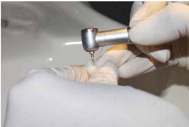
Fig. 1. Técnica de Ameloplastia

El análisis estadístico se realizó con ayuda del programa estadístico SPSS versión 20.0 (Chicago Ill), evaluó las frecuencias y porcentajes de la variable microfiltración en cada grupo de estudio (técnica con ameloplastia, aire abrasivo y control).