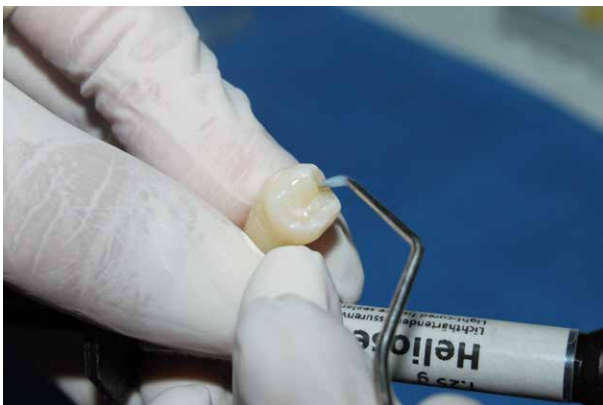
Fig. 3. Aplicación del Sellante