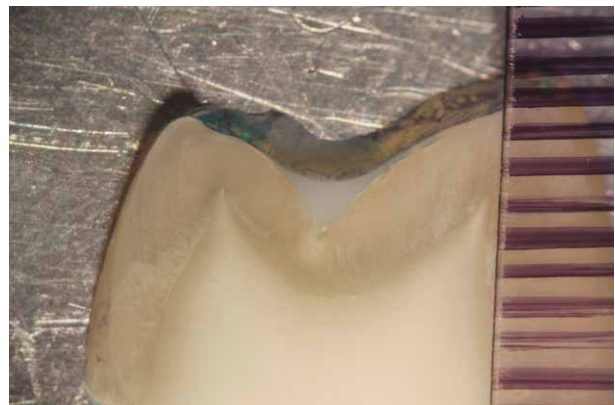
Fig. 6. Grado 2, Penetración de más de 500 micras