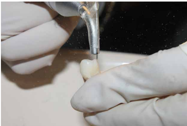
Fig. 2. Técnica con aire abrasivo