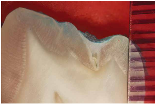
Fig. 7. Técnica con aire abrasivo que evidencia muestras con smear layer

Enseguida se comenzó con el análisis bivariado que consistió en asociar la variable microfiltración con técnica de aplicación de sellantes mediante la prueba de Chi cuadrado. Se trabajó a un nivel de significancia de 0.05.