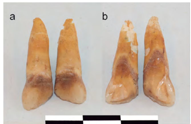
Figura 3. Incisivos centrales modificados (Tomado de Roksandic et al.)

En resumen, la antropología dental brinda un aporte a la antropología forense de mucho valor para el análisis de restos óseos u osamentas, y su identificación. El uso de caracteres morfológicos dentales para la determinación de la ancestría o incidencia racial, combinado con la observación y el análisis de rasgos craneofaciales, es de gran utilidad para la determinación del origen americano, europeo, asiático o africano de un sujeto (33,34).