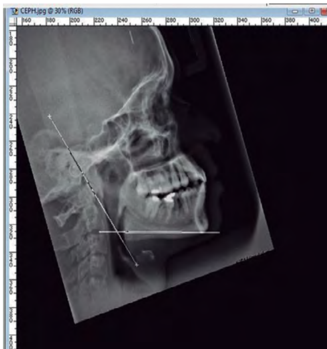
Figura 1. Línea horizontal en el borde inferior del cuerpo de la mandíbula y línea tangente a través del borde posterior de la rama (tomado de: Belaldavar et al.).

para diferenciar el dimorfismo sexual en el proceso de identificación.