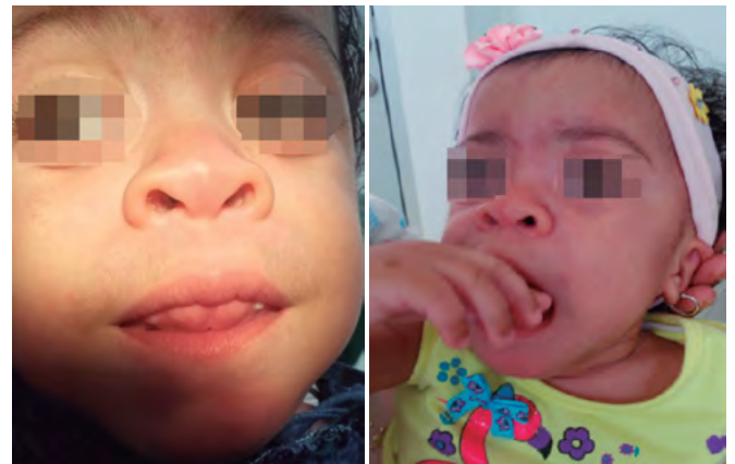
Figura 2A y 2B. Cabeza grande, cuello corto, incompetencia labial por hiperplasia gingival y leve lengua agrandada, agrandamiento del cráneo y una dimensión anteroposterior larga son características típicas del síndrome de Maroteaux-Lamy.