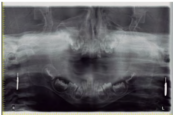
Figura 4. La radiografía panorámica muestra los dientes no erupcionados y varias radiolucencias pericoronales.

con radiolucencias pericoronales que se asemejaban a quistes dentígeros (figura 4). El árbol genealógico de 3 generaciones de la familia reveló consanguinidad (figura 5).