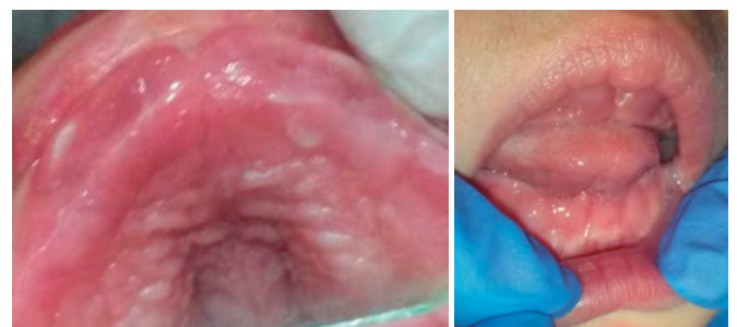
Figura 3A y 3B. Hiperplasia gingival generalizada en maxilar superior e inferior, retraso en la erupción de los dientes anteriores, paladar profundo con poco desarrollo en el crecimiento del plano medio sagital, macroglosia.