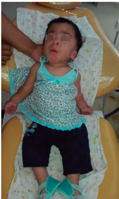
Figura 1. Esta fotografía muestra la facies característica del síndrome de Maroteaux-Lamy.

Se tomó radiografía panorámica en circunstancias difíciles (la paciente no cooperaba y estaba ansiosa), el estudio radiográfico reveló dientes no erupcionados