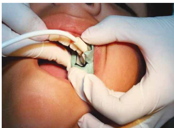
Fig. 2. Posicionamiento del sensor.

Tampoco se encontró diferencia para el sangrado pulpar leve fue 83.75% +/-2.5%, moderado 85% +/-4.35% y severo 85.5% +/-0.70%.(p=0.575). La saturación para el color del sangrado pulpar rojo fuerte fue 83.60% +/-2.63% y rojo vinoso de 88.33% +/-3.51%.(p=0.077). La saturación de oxígeno para la hemostasia a los 5 minutos fue 85.20% +/- 4.43%, luego de 5 minutos 84.40% +/-2.51% no cesa 84.33% +/- 4.04%. (p=0.995).