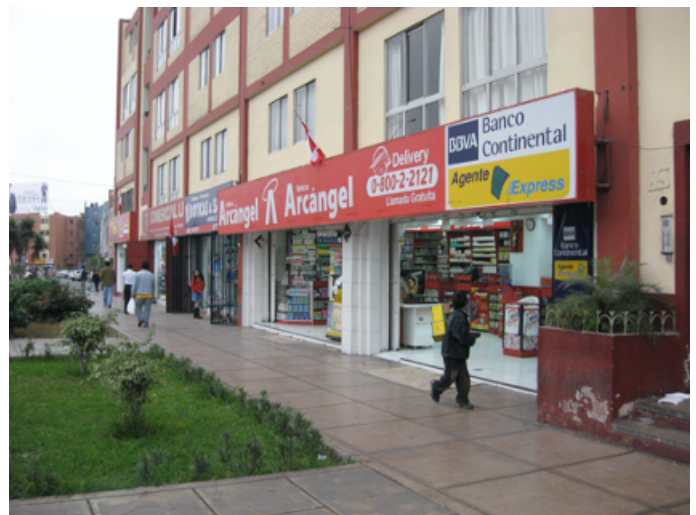
Figura 3: Competencia entre farmacias. Hilera de farmacias en Lima (Perú). Fecha: 2012.

El acceso incontrolado a antimicrobianos no se limita solo a sanidad humana, también afecta a la ganadería. Así, en algunos países, el acceso a antibióticos por parte de ganaderos es tan sencillo como la simple compra, en ausencia de cualquier requisito o experiencia, en un local comercial. Similarmente, la venta de piensos medicados es una práctica común en numerosos países (Salam et al. , 2023).