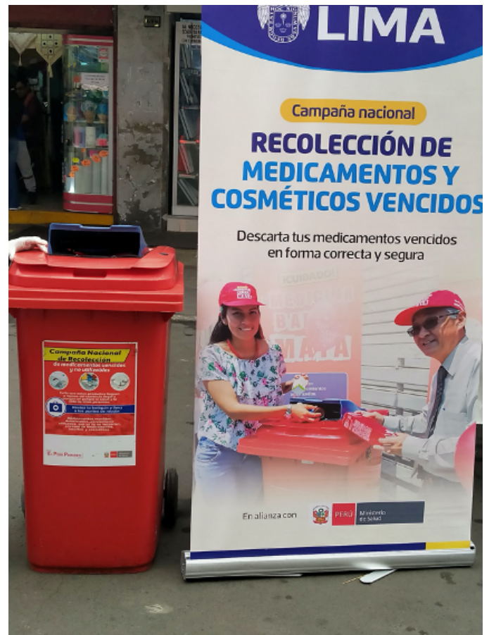
Figura 4: Campaña de concienciación sobre descarte controlado de medicamentos.

Los antibióticos, al igual que el resto de los medicamentos, no deberían descartarse en el ambiente, sino ser procesados para su destrucción de manera correcta, a este efecto en numerosos países existen sistemas de recogida de medicamentos sobrantes o caducados, a menudo vinculados a farmacias y oficinas de expendio de medicamentos (SIGRE, 2023) (Figura 4). No obstante, a menudo se descartan en la basura o el inodoro, llegando a suelos o aguas y pudiendo afectar a animales de vida libre (Calderón and Tarapues, 2021). Mención aparte merece indicar el descarte natural, asociado a las excretas de personas o animales tratados con antimicrobianos. Estas excretas, como se ha comentado, pueden contener ya sea antibiótico, o metabolitos de este, que al igual que en el caso anterior llegan a aguas o suelos (Manyi-Loh et al. , 2018). Reseñar que, los antimicrobianos usados en piscifactorías o granjas también pueden alcanzar el medio ambiente, al acabar en las aguas de ríos, lagos o mares, siendo a menudo descartadas directamente al medio ambiente e inclusive utilizadas con fines agrícolas (Habiba et al. , 2023; Li et al. , 2012; Qader et al. , 2023).