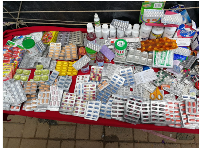
Figura 2: Venta callejera de medicamentos Venta callejera de medicamentos en Pucallpa (Perú). Fecha: octubre 2018.

de farmacias, compitiendo entre ellas, es algo fácilmente constatable (Figura 3).