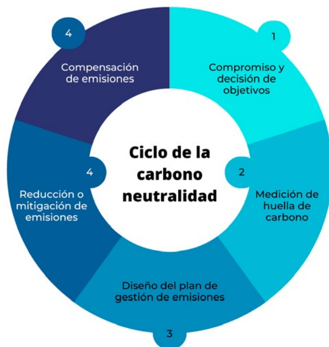
Figura 1. Procesos para llegar a la carbononeutralidad en universidades.

directamente) y las emisiones indirectas de Alcance 2 y 3 (procedentes de la generación de electricidad adquirida y otras fuentes externas, respectivamente). El GHG Protocol se ha convertido en una referencia ampliamente reconocida para la medición y notificación de las emisiones de GEI a nivel corporativo debido a su uso del Análisis Input-Output Ambientalmente Extendido (EIOA), una variante específica del Análisis del Ciclo de Vida (ACV). El EIOA es un método que integra datos económicos y ambientales para evaluar el impacto ambiental total de una economía, incluidas las emisiones de gases de efecto invernadero (Diniz et al. , 2021).