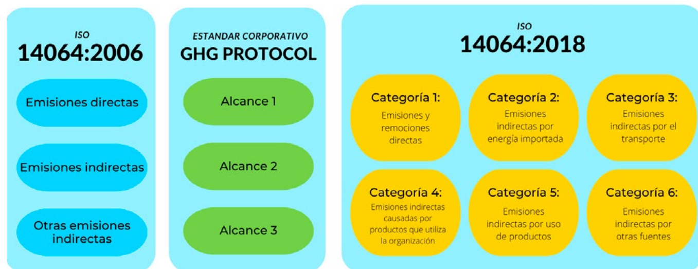
Figura 2. Evolución de las metodologías de medición de HC.