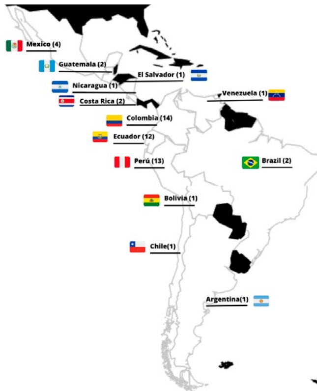
Figura 4. Número de artículos por país (n = 55).

La tabla 1 contiene un resumen de los artículos que establecen los estándares de medición, principal fuente de medición y alcance de la HC por universidad. Se identificaron 16 estudios de tipo parcial (P) de HC: Bolivia (6,25 %), Brasil (6,25 %), Colombia (6,25 %), Ecuador (37,5 %), Perú (31,25 %) y Guatemala (12,5 %). Es decir, son investigaciones que describen que su HC es equivalente a 3 categorías de medición, entre las cuales se destaca la medición parcial para el consumo de electricidad y combustibles de manera directa e indirecta. Para los estudios semicompletos (SC) se obtuvieron 23 estudios: Colombia (39,1 %), Ecuador (21,7 %), Perú (21,7 %), México (4,3 %), Nicaragua (4,3 %), El Salvador (4,3 %) y Argentina (4,3 %), en donde se abordan en la medición de 4 a 5 componentes de medición, aunque falta la diferenciación