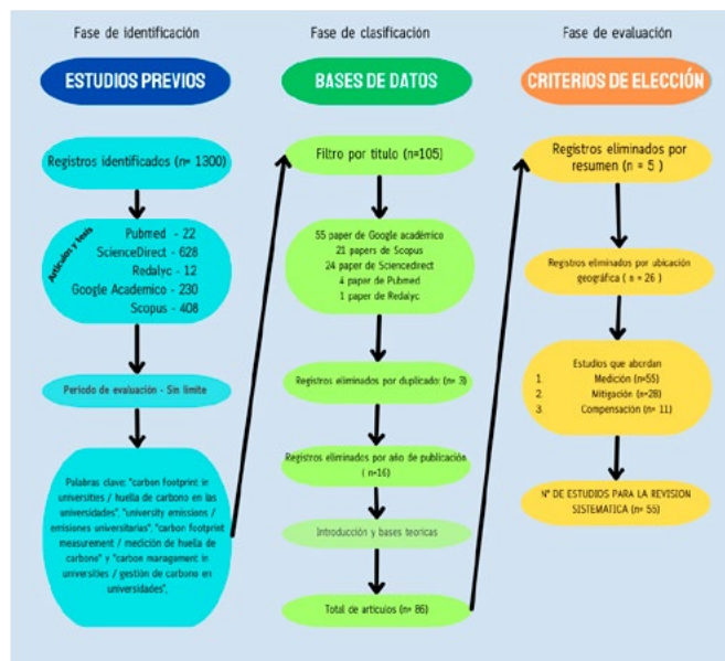
Figura 3. Modelo PRISMA para la recopilación de artículos en revisiones sistemáticas.

La tabla 1 contiene un resumen de los artículos que establecen los estándares de medición, principal fuente de medición y alcance de la HC por universidad. Se identificaron 16 estudios de tipo parcial (P) de HC: Bolivia (6,25 %), Brasil (6,25 %), Colombia (6,25 %), Ecuador (37,5 %), Perú (31,25 %) y Guatemala (12,5 %). Es decir, son investigaciones que describen que su HC es equivalente a 3 categorías de medición, entre las cuales se destaca la medición parcial para el consumo de electricidad y combustibles de manera directa e indirecta. Para los estudios semicompletos (SC) se obtuvieron 23 estudios: Colombia (39,1 %), Ecuador (21,7 %), Perú (21,7 %), México (4,3 %), Nicaragua (4,3 %), El Salvador (4,3 %) y Argentina (4,3 %), en donde se abordan en la medición de 4 a 5 componentes de medición, aunque falta la diferenciación