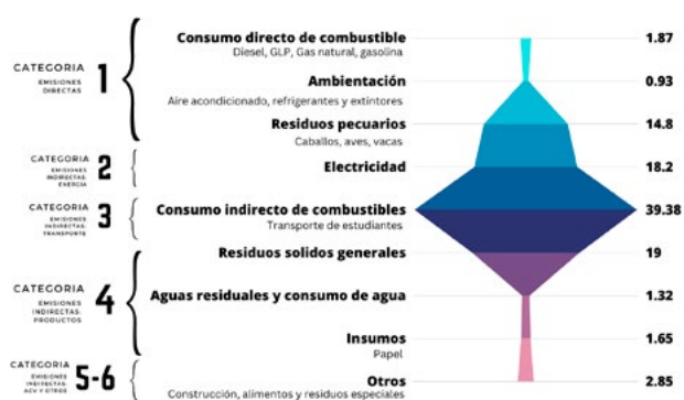
Figura 5. Distribución por categoría de HC universitaria según ISO 14064:2018.