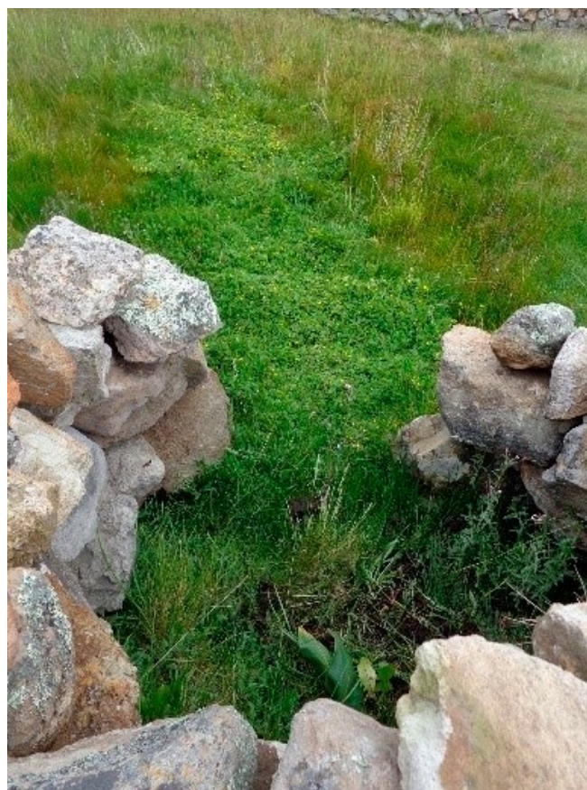
Figura 5. Cultivo y protección de la planta llamadora de agua. Se muestra la putacca , excelente conservador de agua.

de aumentar el caudal de los manantiales para consumo humano y animal (mejora de pastizales). La tercera acción recomendada es el fortalecimiento y la creación de viveros con plantas llamadoras de agua (por ejemplo, la putacca ), que tienen la función de abastecimiento de plantas locales y llamadoras de agua para el fortalecimiento y la construcción de las qochas y los manantiales (para ambas etapas de la SCALL).