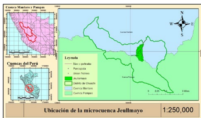
Figura 1. Ubicación de la microcuenca Jeullamayo. Jeullamayo pertenece a la cuenca del Mantaro y la vertiente del río Amazonas. El distrito Chuschi al que pertenece está entre las cuencas Pampas y Mantaro.

El sector agropecuario de la zona rural peruana es un factor esencial para el desarrollo socioeconómico; sin embargo, este sector posee problemas frente a los tiempos y climas extremos que provoca el cambio climático. A nivel nacional, Galarza y von Hesse (2011) estimaron que los costos económicos de este cambio serían USD 65 millones y USD 3475 millones si se consideran los daños a 2030 y 2100, respectivamente. Estos montos se calcularon tomando en cuenta un escenario base y futuro propuesto por el Panel Intergubernamental de Cambio Climático. A nivel regional, a 2050 el sector agrícola de Ayacucho sería afectado por esta variabilidad climática, disminuyendo los rendimientos de la haba, arveja y maíz (FAO, 2017). Asimismo, el Plan de Gestión de Riesgos y Adaptación al Cambio Climático en el Sector Agrario (PLANGRACC-A) (2012) indicó que 15 distritos de Ayacucho presentan vulnerabilidad agrícola alta, 1 distrito posee vulnerabilidad muy alta y 40 distritos tienen vulnerabilidad pecuaria alta (Midagri, 2012).