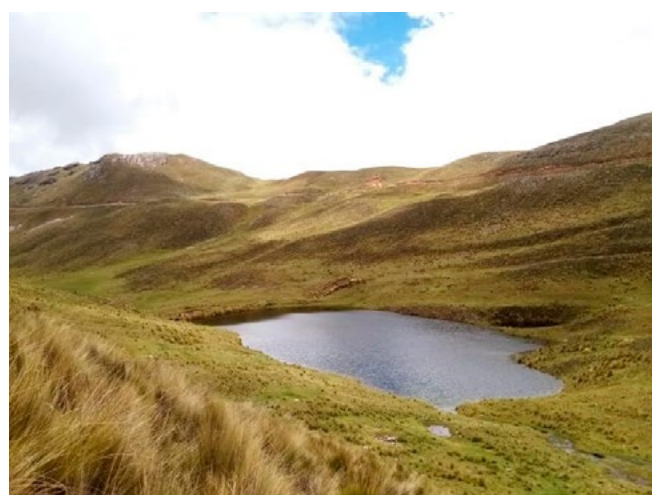
Figura 2. Modelo de laguna de agua de lluvia. Laguna criada Quyllurqocha (Tuco, Quispillacta). La infraestructura de la laguna son cúmulos de tierra y piedras.

en la pérdida de ganancias de los agricultores ante una escasez de agua. Del mismo modo afecta indirectamente a la ciudad de Huamanga y Huanta (figura 3), puesto que el agua potable de la ciudad está condicionada por la cantidad y calidad de agua captada en la parte alta de la cuenca del río Cachi, como lo es la microcuenca de Jeullamayo. Entonces, la limitada seguridad hídrica, el problema central, provoca que el cambio climático tenga mayor incidencia, para finalmente provocar como efecto final un bajo nivel de desarrollo socioeconómico en las comunidades Puncupata y Unión Potrero.