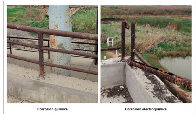
Figura 2. Corrosión química y electroquímica en las barandas del mirador del CREA, junio de 2023.

A través del cuestionario virtual difundido entre el personal técnico de Prohvilla se logró conocer la opinión de los especialistas que trabajan en las oficinas de obras y ecoturismo, con dos preguntas de opinión libre respecto a la situación actual del CREA. Para el desarrollo de