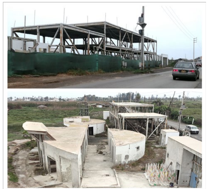
Figura 3. Fotografías del estado actual del CREA, junio de 2023.

Respecto a la primera pregunta sobre una posible demolición o reúso de la infraestructura actual del CREA, los resultados arrojaron que hubo una tendencia por el reúso parcial para fines educativos y de investigación. Asimismo, en relación con la pregunta sobre el impacto ambiental actual que está causando el abandono de esta construcción en el área natural, la mayoría coincidió en que este se ve reflejado en la contaminación visual y paisajística, así como en la vegetación, al afectar las cubiertas vegetales del área en conflicto. Se percibe como un pasivo ambiental que genera una alteración en el paisaje.