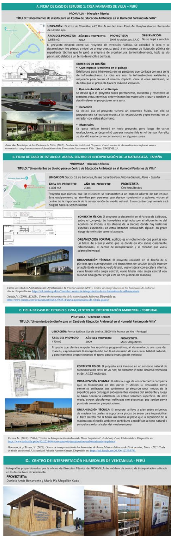
Figura 5. Casos de estudio analizados y del Centro de Interpretación Humedales de Ventanilla.

Adicionalmente a estos tres referentes, es importante hacer mención del centro de interpretación que se encuentra en el Área de Conservación Regional Humedales de Ventanilla (figura 5d), donde también se realizan diferentes actividades ligadas a la educación ambiental, como recorridos a través de guías expertos, charlas informativas y talleres prácticos, además de actividades culturales, con el objetivo de inspirar a las personas a cuidar su entorno y ser defensores activos del medioambiente (Área de Conservación Regional Humedales de Ventanilla, 2023).