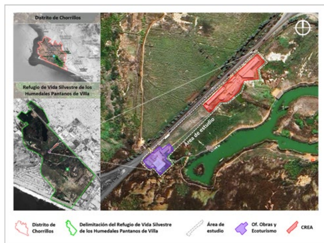
Figura 1. Mapa de ubicación del área de estudio y de las zonas de estudio enfocadas en las instalaciones actuales (CREA y Prohvilla) en el humedal los Pantanos de Villa.

El RVSPV se ubica en el distrito de Chorrillos, provincia y departamento de Lima (Perú). En la figura 1 se bordea el área de estudio para la presente investigación, la cual comprende desde la zona donde se encuentran las actuales oficinas de Obras y Ecoturismo de Prohvilla hasta las instalaciones abandonadas del CREA.