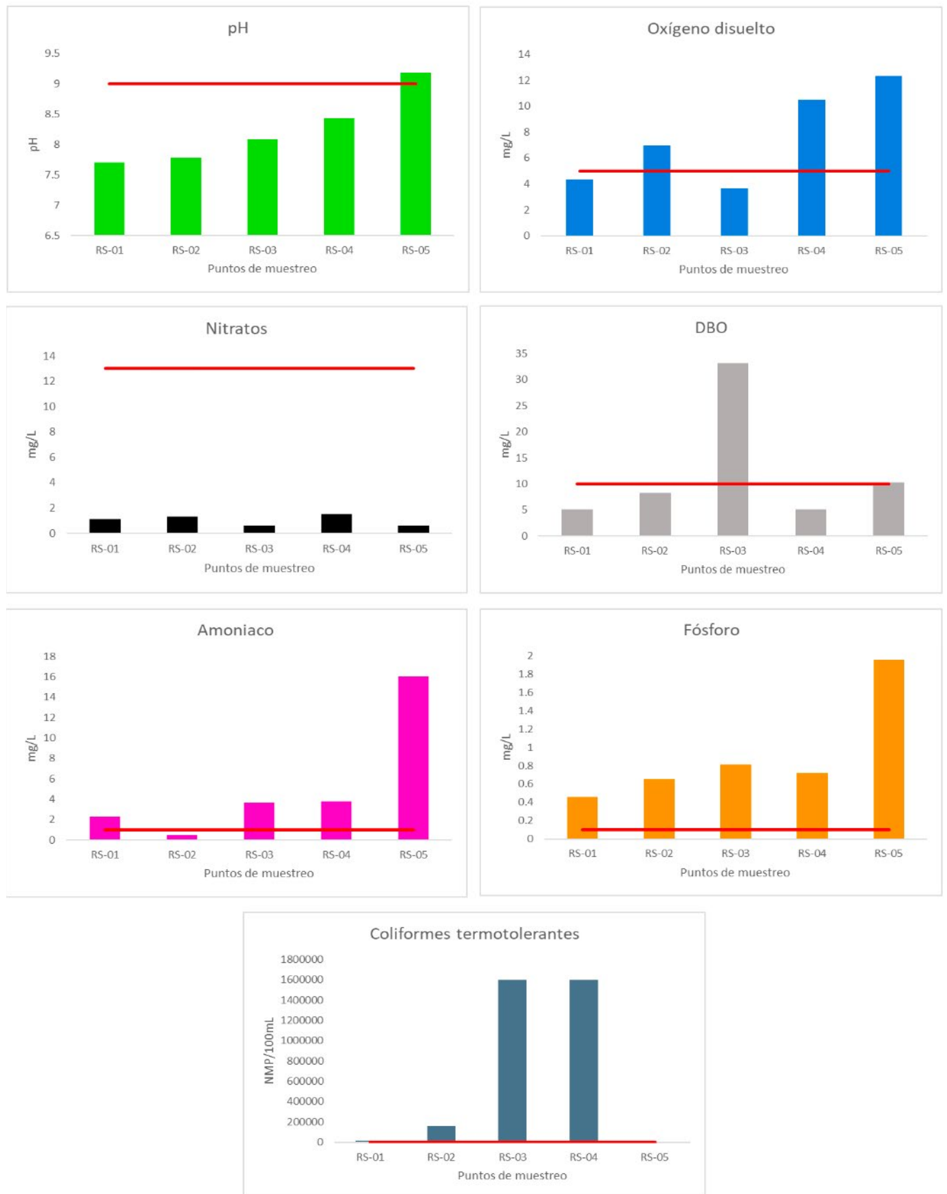
Figura 2. Resultados de los parámetros fisicoquímicos y microbiológicos del canal Surco. La línea roja indica el límite establecido para cada parámetro por el ECA agua (Minam, 2017).