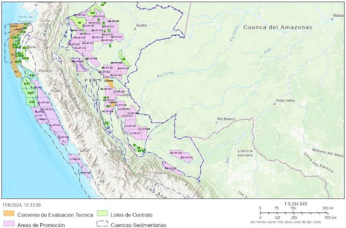
Figura 1. Mapa de lotes de contrato

Reducir el impacto industrial y preservar la diversidad biológica es determinante para gestionar los recursos marinos de manera sostenible (Thompson et al. , 2020). El