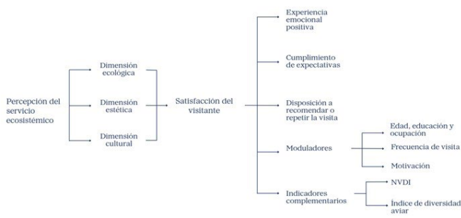
Figura 1. Modelo conceptual de la relación entre percepción del entorno y satisfacción del visitante en este estudio.