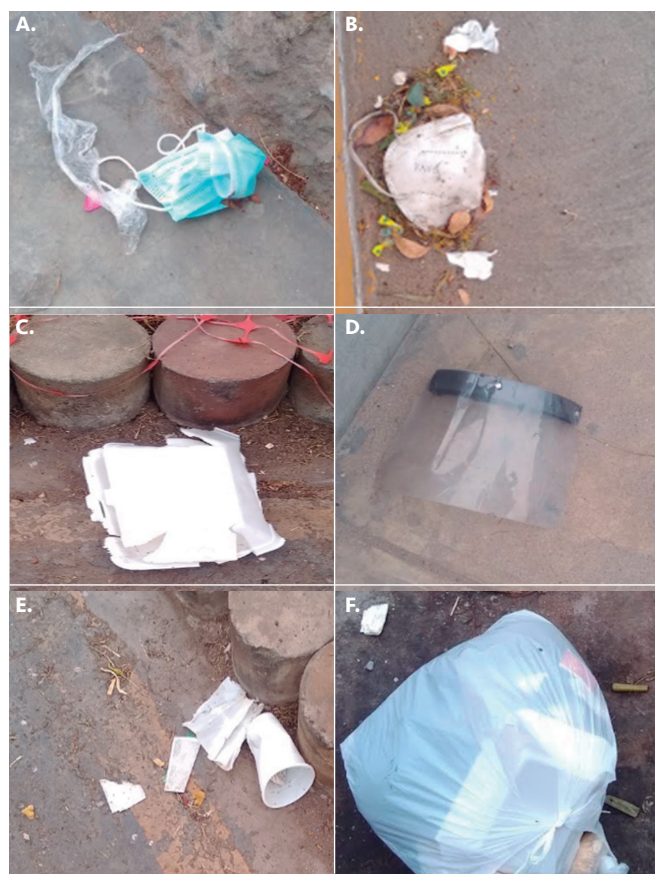
Figura 2. Algunos residuos plásticos encontrados en las calles de Lima durante el periodo de estado de emergencia sanitaria (agosto de 2020). Se observan algunos EPP, como mascarillas descartables (a, b), protectores faciales (d) y otros restos conformados por plásticos de un solo uso (c, e y f). Muchos de estos artículos se pueden transformar en focos infecciosos de la covid-19, como es el caso de las EPP. Los residuos plásticos de un solo uso constituyen uno de los mayores problemas de contaminación en los ecosistemas.

Los desechos plásticos biocontaminados necesitan ser separados y transportados para su disposición final, bajo la responsabilidad del personal capacitado y con todos los requerimientos de bioseguridad (Minam, 2020a). Muchos de estos residuos son tratados con métodos térmicos, como la incineración y la pirólisis. Estos métodos son los que más se aplican en el tratamiento de plásticos no biodegradables, lo que genera gases de efecto invernadero y otras sustancias tóxicas como los PCB (bifenil policlorinados) dioxinas, furanos y metales pesados (Makarichi et al. , 2018; Rajmohan et al. , 2020; Loganathan y Masunaga, 2020).