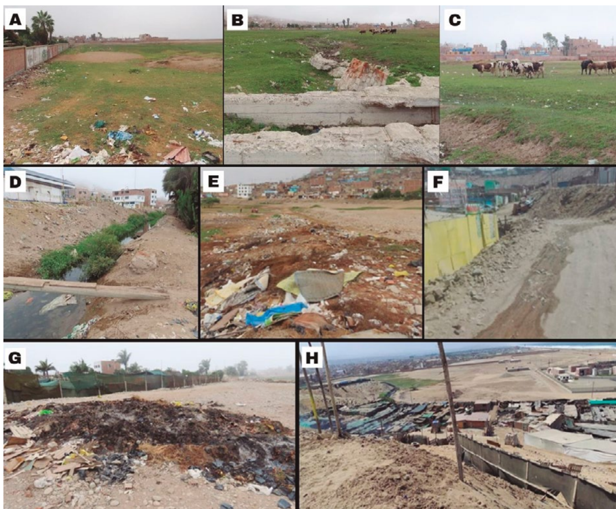
Figura 5. Estado del relicto de humedal La Chira en marzo 2021. A: extremo de la zona del relicto de humedal con Bello Horizonte; B: canal de espejo de agua del relicto; C: actividad de pastoreo; D: residuos sólidos en canal; E: residuos sólidos en el contorno; F: efluentes domésticos; G: residuos de viveros alledaños; H: asentamientos humanos alledaños.

infecciosas, que pueden exponer a todo ciudadano a microorganismos como Escherichia coli , Salmonella spp., coliformes fecales, entre otros que se proliferan en esas condiciones (Moreno y Alarcón, 2010).