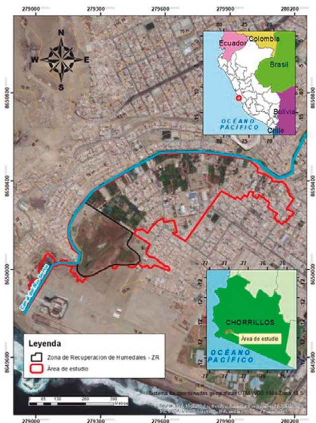
Figura 1. Zona de estudio delimitada en el relictos La Chira. Elaboración propia.

Las temperaturas de la zona una temperatura promedio de 15 °C a 26 °C. El periodo de llovizna, aunque muy leve, se da entre junio y septiembre (ParksWatch, s. f.).