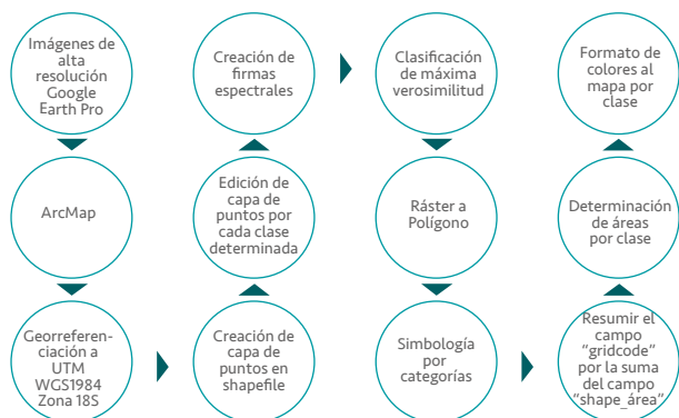
Figura 2. Proceso operacional para generar mapas de uso de suelo por año del relicto La Chira.

Para la determinación de las clases de uso de suelo en la realización de mapas se usó bibliografía y se realizaron